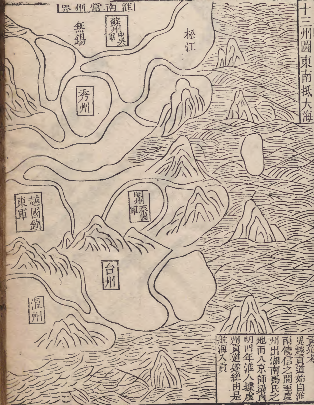
十三州圖東南抵大海

貢道考 吳越貢道始自淮 南饒信之間至度 州出湖南馬氏之 地而入京師梁虞 明四年淮人據度 州貢道遂絕由是 航海入貢