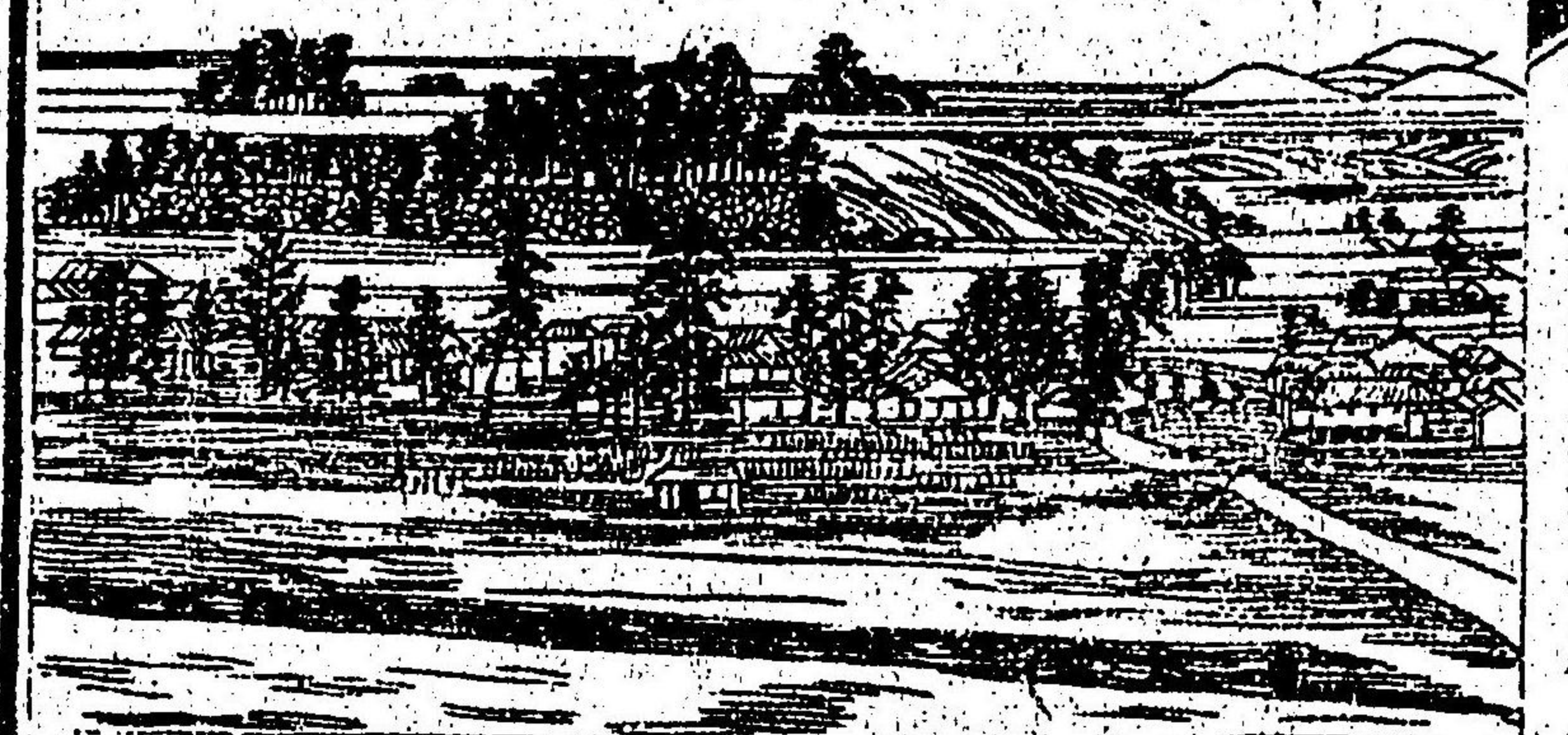
津山市中東南部ノ圖

餘ノリ、郡中西南ノ地ハ、田園稍開ケテ山少ナシ、津山ハ、津山川ニ浴ビテ三等國道ノ衝ニ當リ、國ノ中央部ニ位シテ、市井頗ル繁盛ナリ、戸數四千二百四十、人口一万四千百八十餘アリ、津山ノ北西一ノ宮村ニ