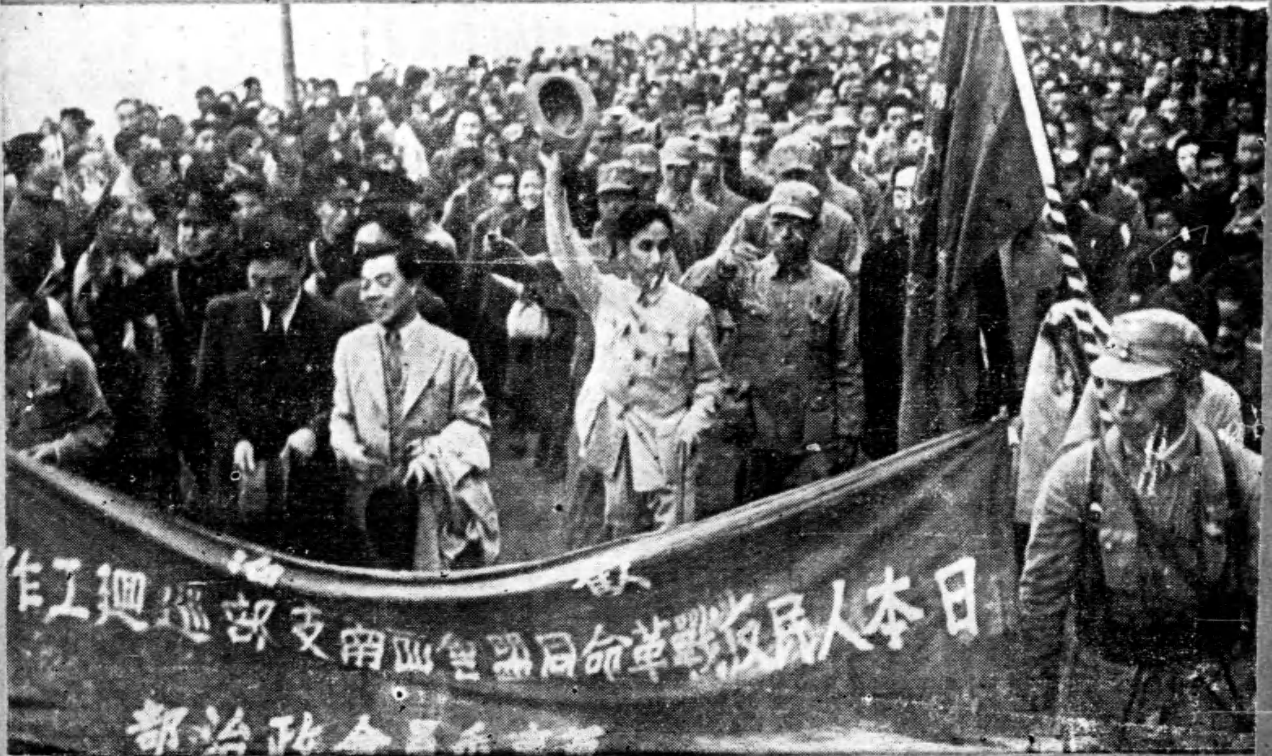
禮答手舉志同團該 迎歡手拍衆民途沿 都首抵團作工迴巡盟同戰反本日 (社光輝) 氏亘地鹿家作略侵反日者揚高帽持手右