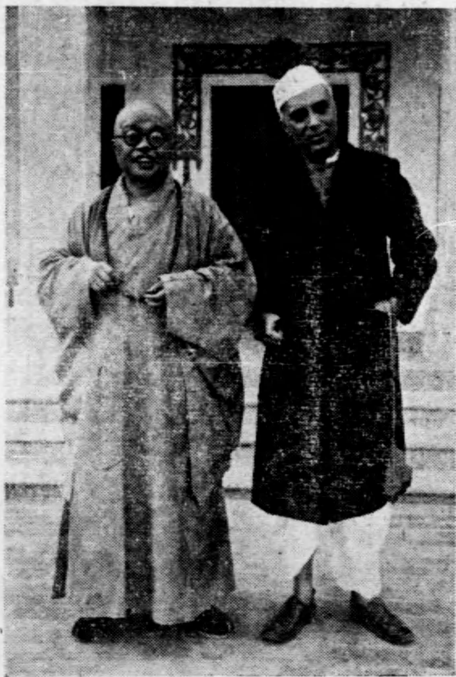
◀ 師法虛太左 魯赫尼右 ▶ —— 攝合度印在 ——

發，取道昆明赴仰，十二月抵在緬仰光逗留幾及一月，今年一月底再入印度，三月廿七日由哥倫坡乘意大利郵船抵達新加坡，四月廿四日離星取道越南返國。五閱月的時間，使他們爭取得遠東幾個佛教國家的人民給予我們抗戰以同情與援助，雖然長途跋涉，動筆動口，但代價是重大的。