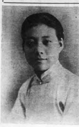
名女李伶芬又芬最近攝影

今日，每當新人到洋地的新家庭，照例要燒火燒三炮。古代羅馬在行過了握手禮之後，便舉行獻祭，新郎新娘繞壇而行。日爾曼俗則由新郎或新娘持餅餅新人繞火三週。照威氏說，這與其他拜火禮很相類，所以他說這是潔淨禮一種，目的在消除不潔。(註六)這個說明，應用於桃花女傳中之禮節，也說得通。因為根香柏葉都是驅邪去穢的東西，燒着繞壇三匝，似有消除一切不祥，才好進門之意。但應用於南北朝的婚禮，就不能圓滿解釋「婿騎而環車三匝」的所以然。或者說成式的記載，略去了她所持之物，說不定。在未有詳確的考證之前，只可存疑，不便妄斷，但無論如何，這是一個通行的風俗，一定含有深意。