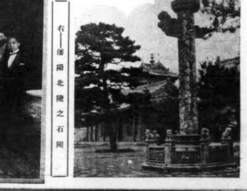
右——潘陽北陵之石閣