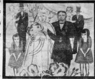
左一 勞婚 右一 禮 孫行子作

通濟門游泳場 初期建設中之首飾。凡百興事。通濟門游泳場。據以代表整個之今日首都。場以河水之半。為其範圍。週圍木欄。魚蝦出入。小舟往來。頑童操游若蛙。吳男