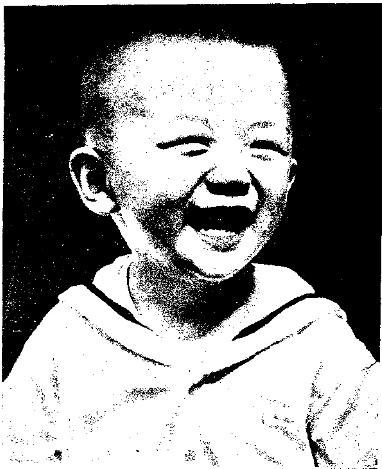
弟 弟 小 高 効 陳

歸 帆 浪漫女郎診療所……葉 孕婦與牙病……詹子猶 出氣……王容光 旅途產子記……阿 豎 孩子為什麼遊戲……王敏儀