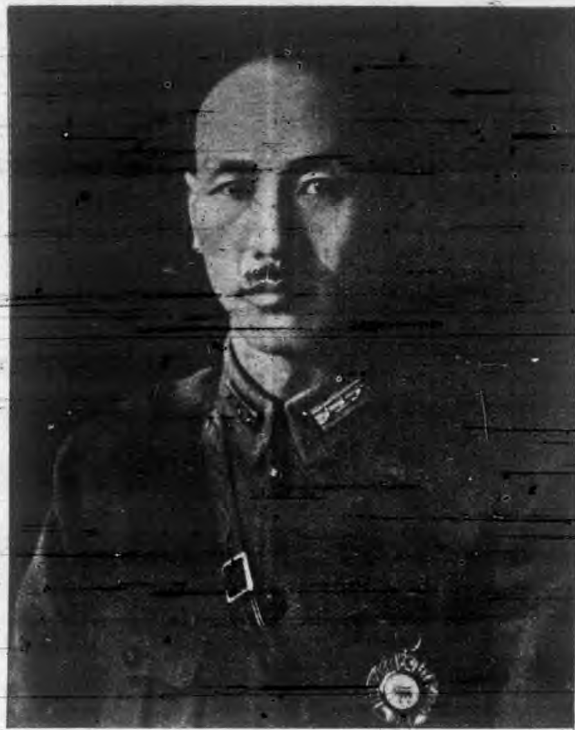
復興中華民族最高領袖蔣總裁