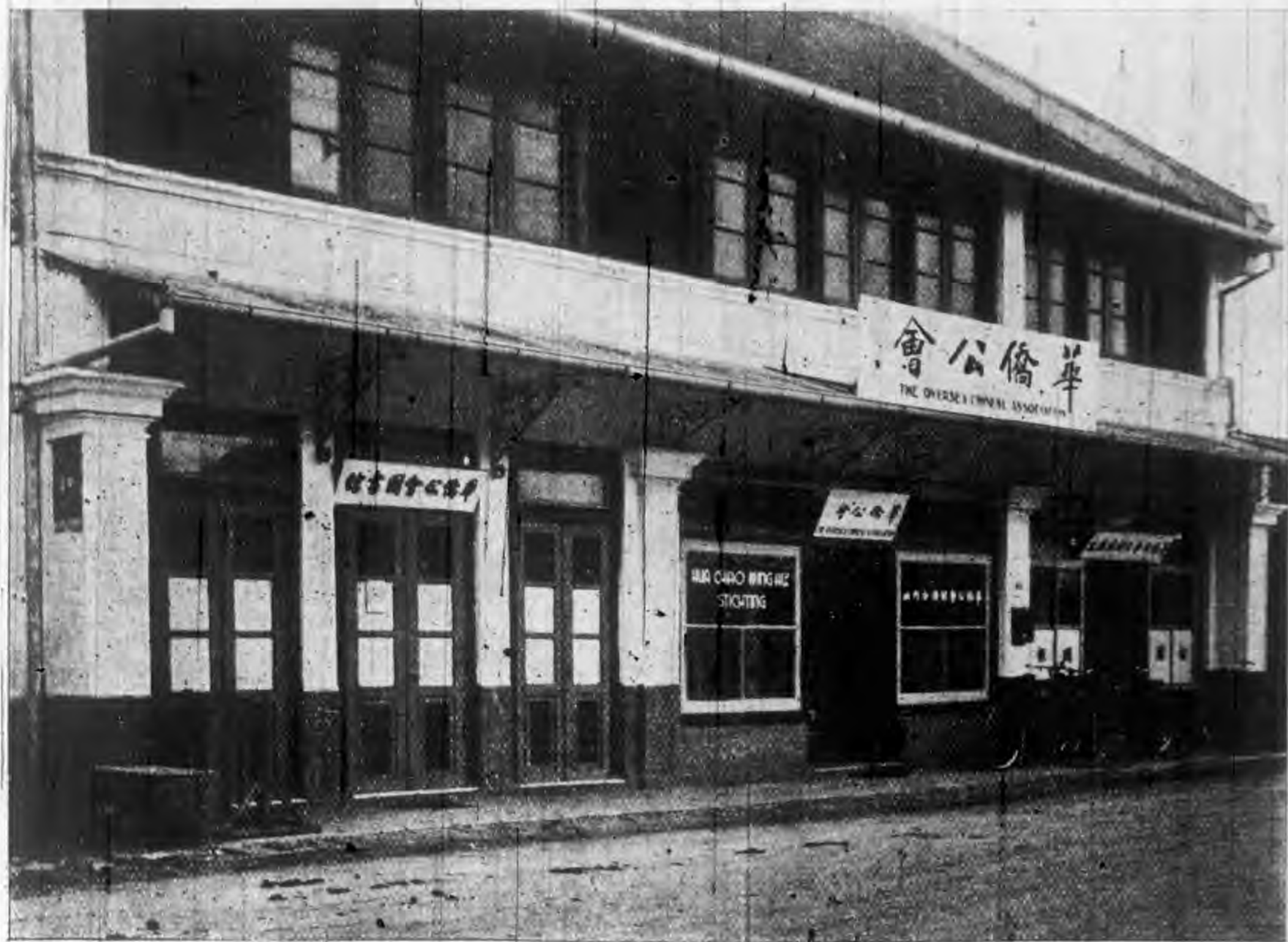
萬隆華僑公會正面圖