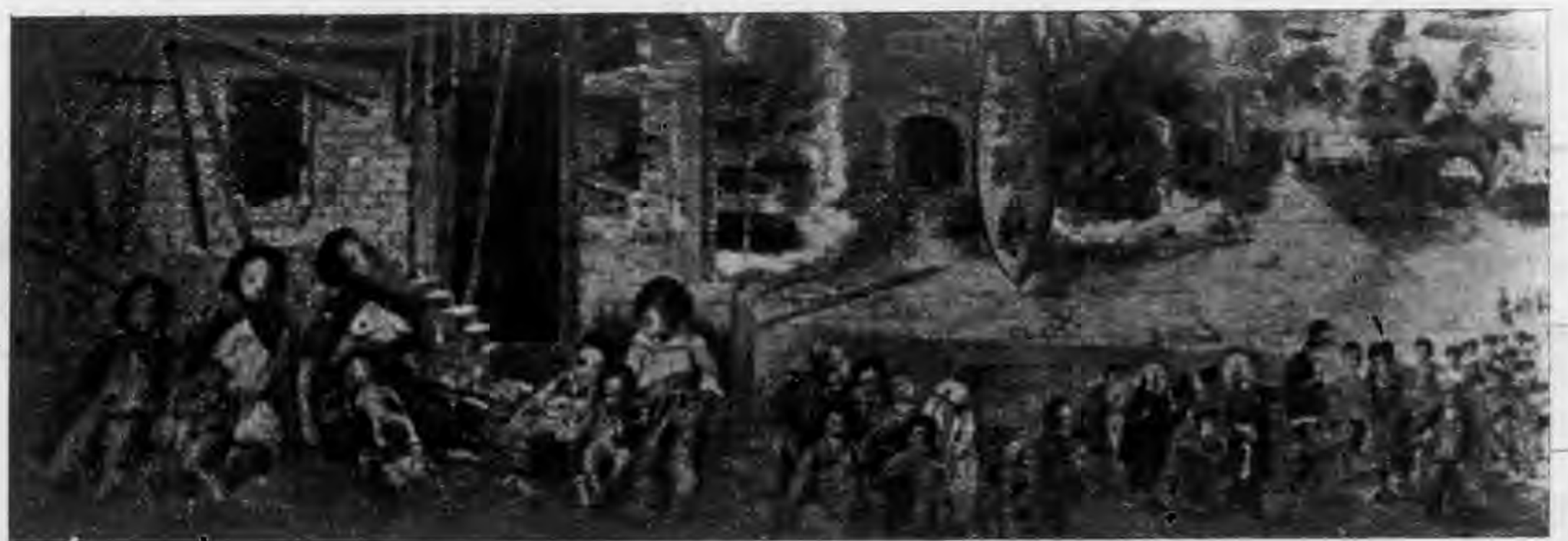
本會參加萬隆華僑捐助祖國慈善夜市之災區難民圖