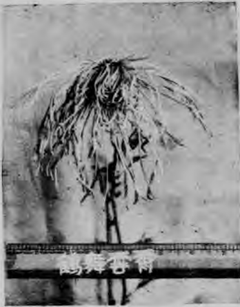
名菊之一（鸚鵡舞雲霄）