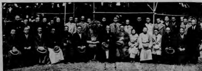
(影會等長局副吳局本與等長市吳席主林)