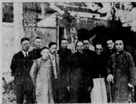
(評判蔡子民謝公展諸先生合影)