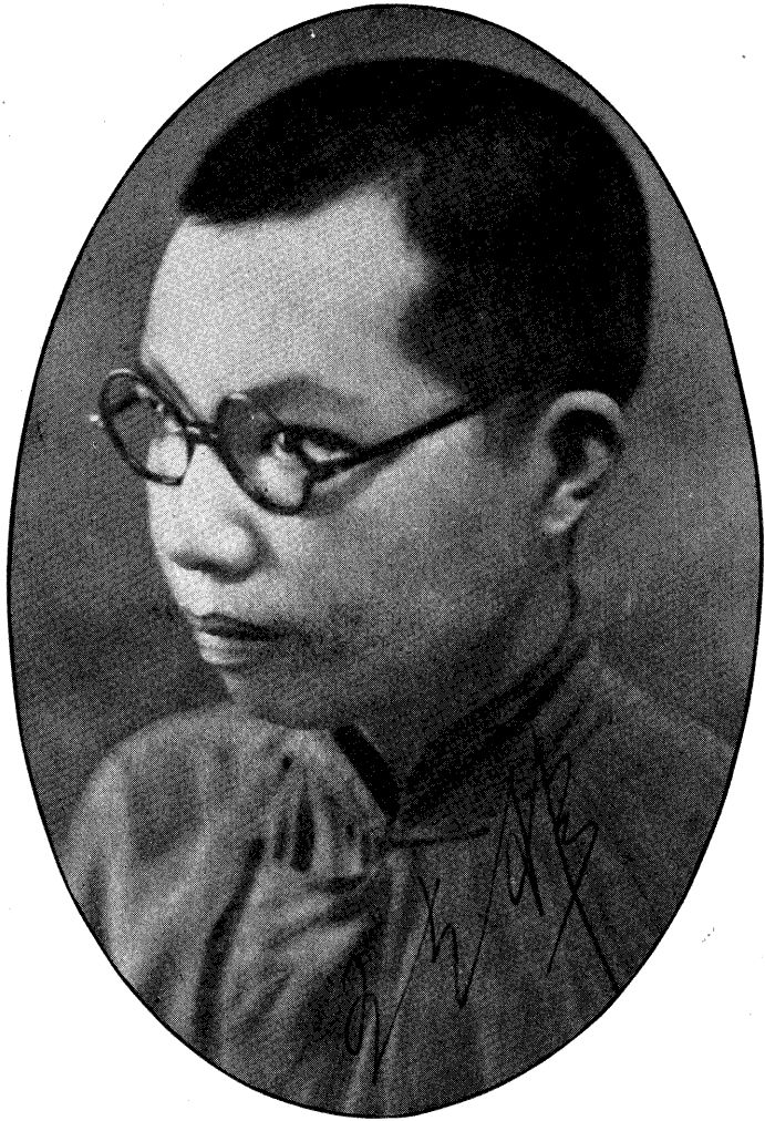
影 近 者 著