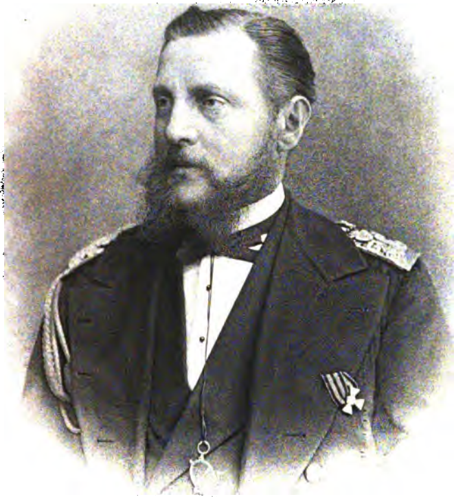
ЕГО ИМПЕРАТОРСКОЕ ВЫСОЧЕСТВО ВЕЛИКІЙ КНЯЗЬ КОНСТАНТИНЪ НИКОЛАЕВИЧЪ.