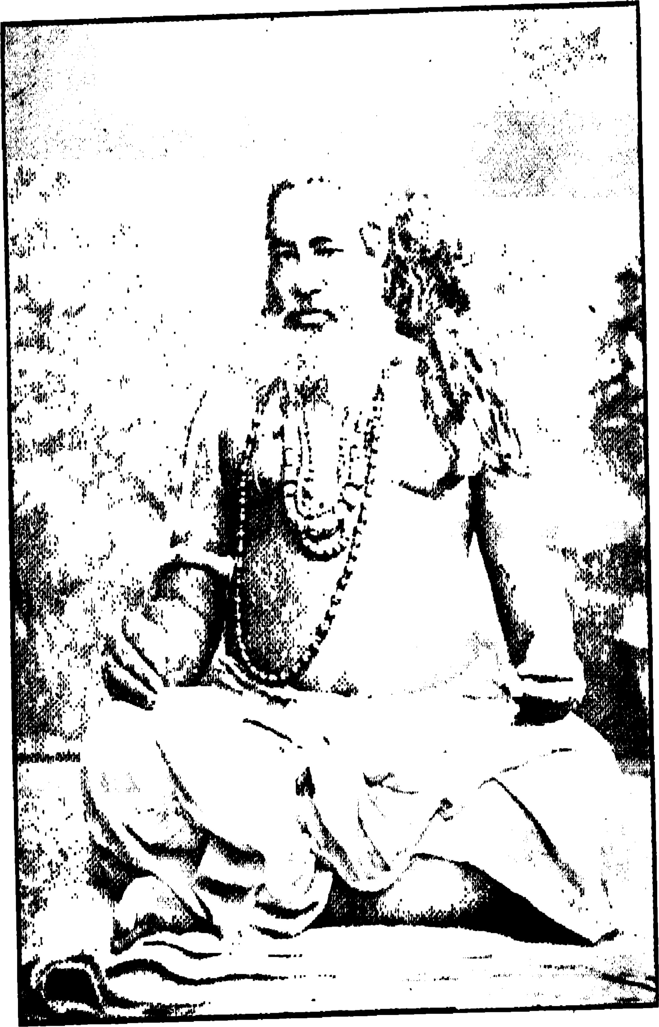
মহাত্মা বিজয়কৃষ্ণ গোস্বামী