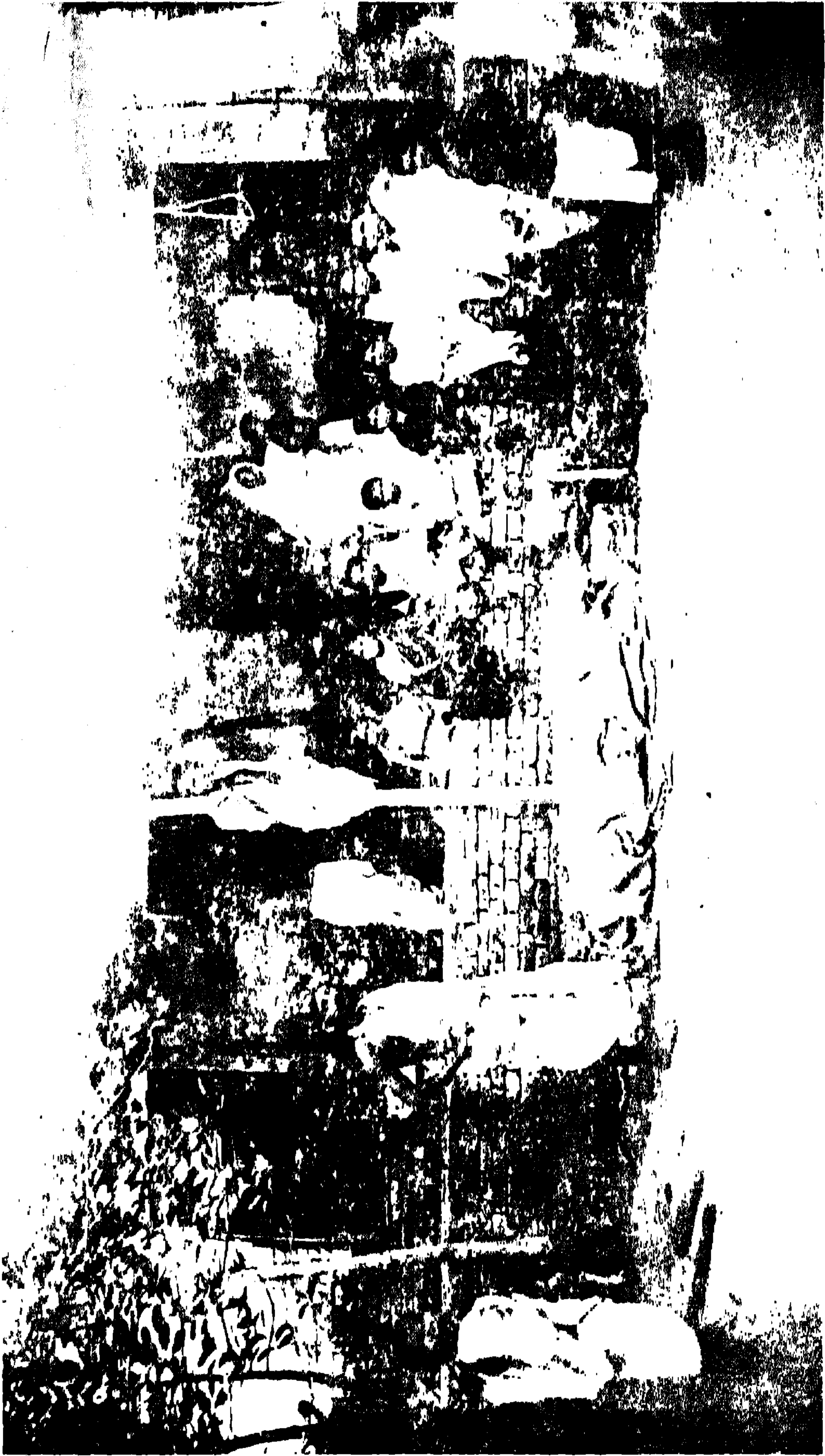
बिहार के एक गाँव में एक परिवार के सदस्यों का एकत्रित होना