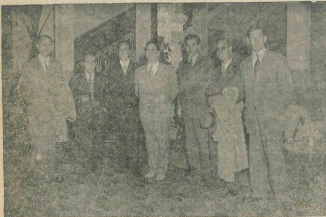
پریروز همراهم دکتر مصدق بعد از مصاحبه با مدیران جراید هلندی این عکس را در پالاس هتل برداشتند

دادگاه از حضار تقاضا کرد سر و صدانکنند تا محاکمه دچار وقفه نشود - پلیس در سر تاسر مسیر حفظ انتظامات را بعهده دارد - دکتر مصدق در محیط ساکت و آرام با لحن مؤثر سخنرانی خود را آغاز کرد. مصدق ۴۰ دقیقه قبل از تشکیل دادگاه با اسکورت پلیس وارد کاخ صلح شد.