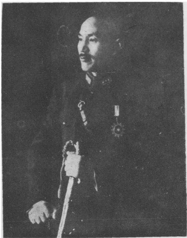
像 肖 袖 領