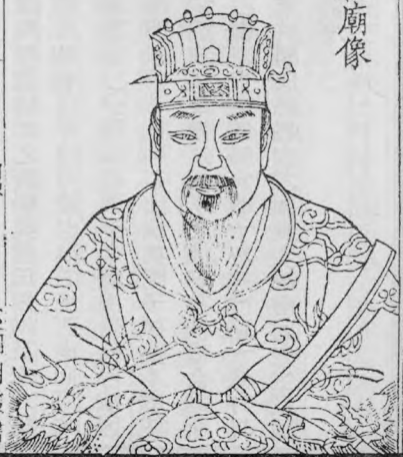
純德彙編卷一 圖像