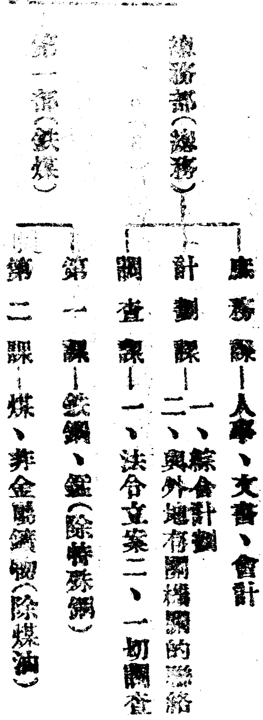
物資調整局機構一覽表

戰時經濟行政的使令，為積極指導國防經濟，以資確保軍需資材，因此，日本吉野商船於一九三八年五月九日，為適應戰時需要，調整重要物資供需，而於商工省內新設一機關，名為戰時物資調整局。本局原係一個計劃(1)不足資源的開發與增產(2)輸入物資的調整(3)物資配給為正的綜合機關。因本局實際兼有物資生產，配給，消費，一貫的行政機構，故稱商工省軍需化的先驅，茲舉其組織系統如下。