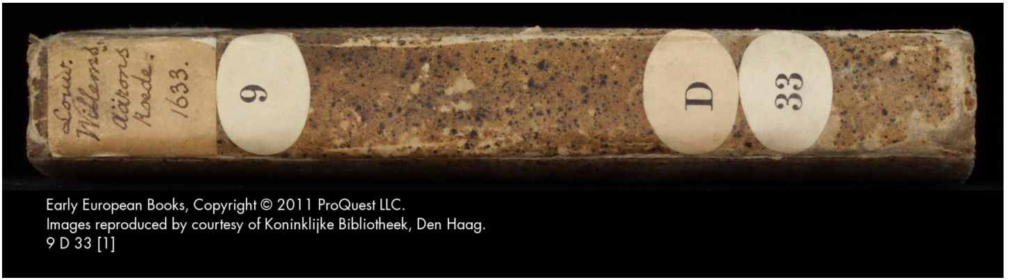
9 D 33 [1]