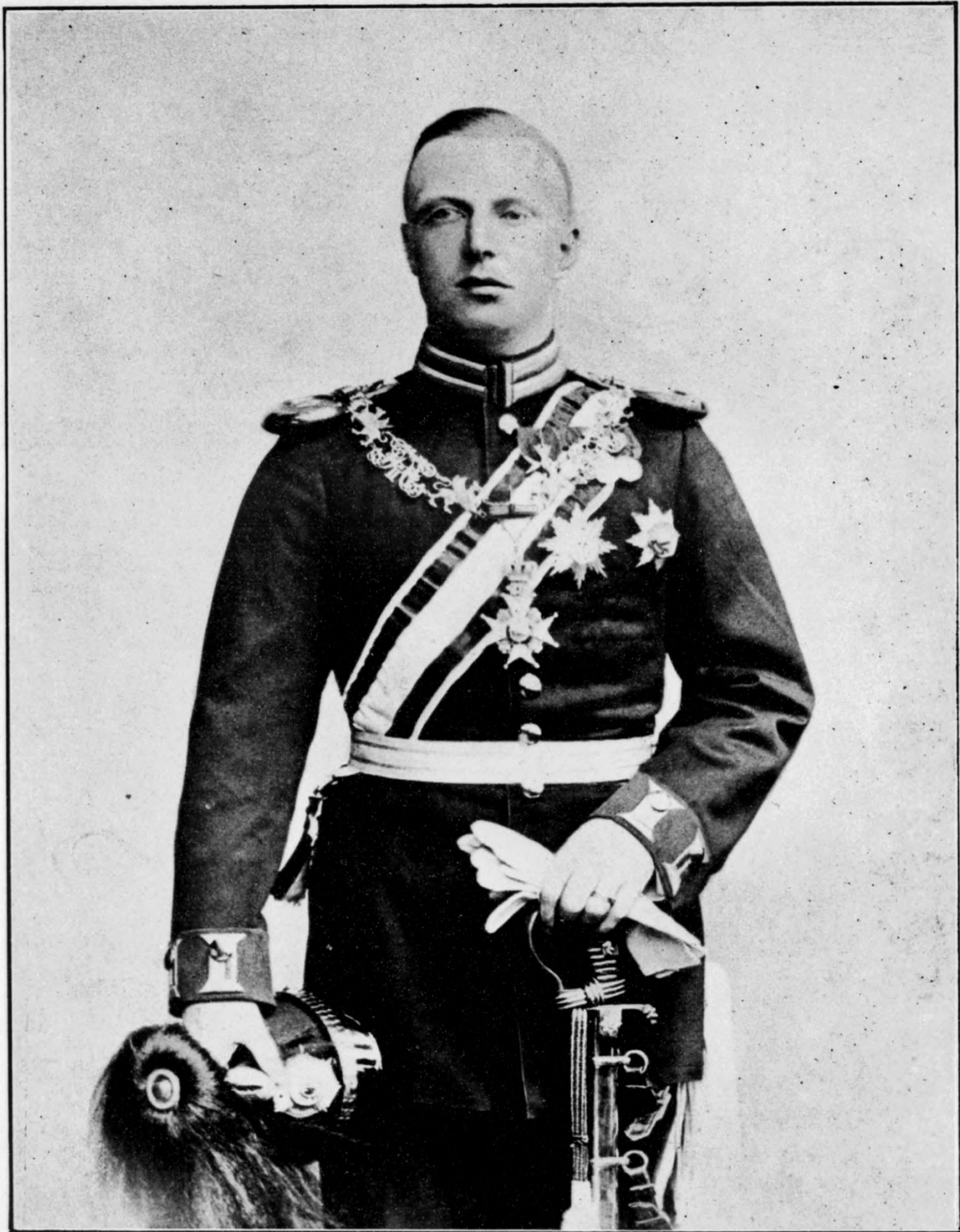
Z. H. Hertog HENDRIK WLADIMIR ALBRECHT ERNST VAN MECKLENBURG SCHWERIN.