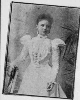
WILHELMINA Koningin der Nederlanden.