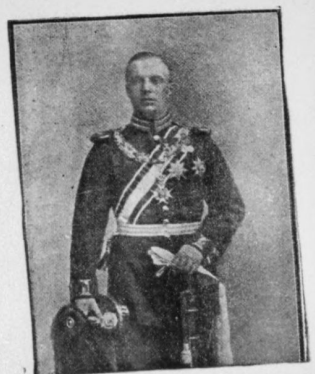
HENDRIK Hertog van Mecklenburg-Schwerin.