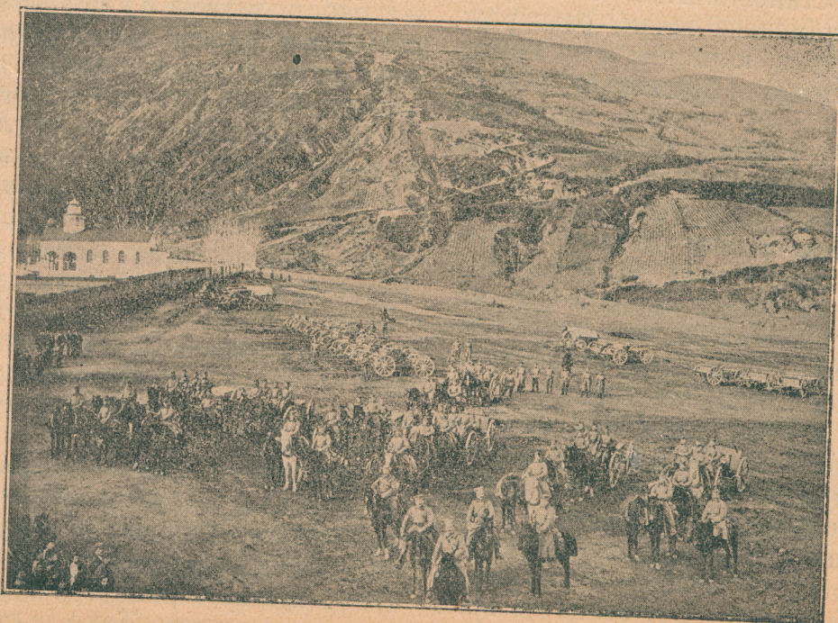
Српска артиљерија у Тетову

Становништво Санџака бави се трговином, земљорадњом и сточарством. Трговина је доста слаба и неразвијена а највише јој смета слаба комуникација. Због тога је и извоз сразмерно мален. Изводи се вуна, сир, кајмак и масло, нешто живе стоке и поврћа. Увози се сва колонијална роба и разне прерађевине као чо-