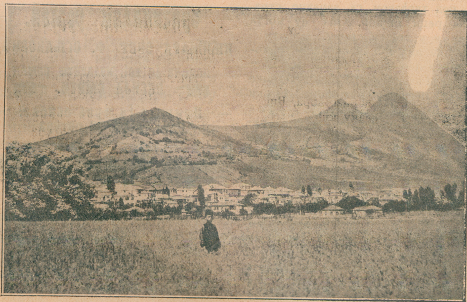
Звечан и косовска Митровица

После пола века, 15. маја 1474. године, палоше под Скадар седам сандака са 60.000 коњаника осим друге војске. 4. јуна стиже и Солиман паша с осталом војском и улогори се на околним брдима. Цела опсадна војска бројаше на сто хиљада. Из два топа, који су бацали зрна, тешка по 40 кила, тучоше Турци Скадар, који је бранио храбри Антоније Лоредан 33 дана (од 27. јуна до 30. јула), а из два, чија су зрна тежила по 115 кила, бацише га 22 дана (од 28. јуна до 30. јула). Из ова четири топа из-