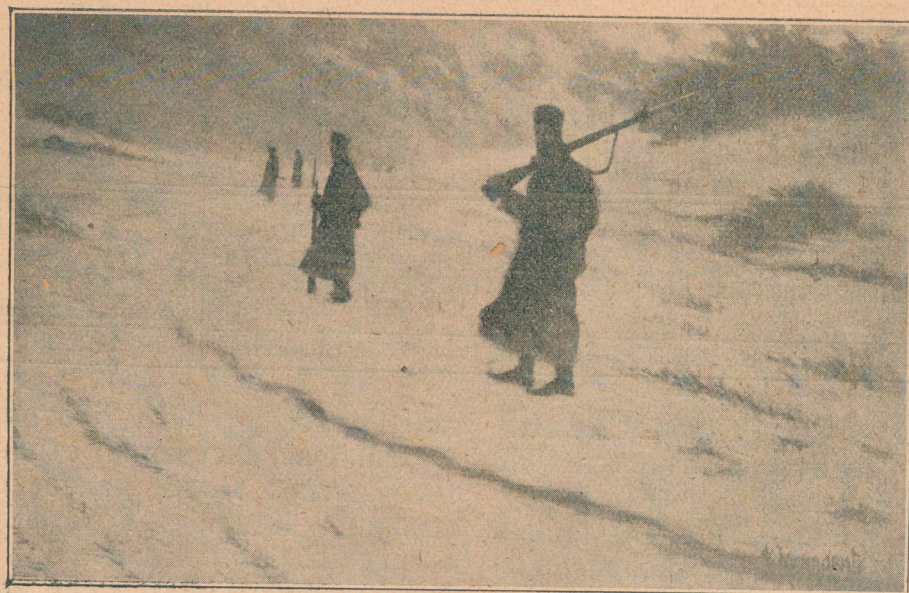
На мртвој стражи

ха, платно, посуђе, гвожђарија, учињена кожа. Увоз је јачи од извоза. Због тога новац излази из овога краја и народ материјално стално назадује. Занати су запуштени и неразвијени. Домаће индустрије и нема. Њу је сасвим убила и потиснула фабричка индустрија која се увози са стране. Једино што се још у малој мери задржало то је израда новопазарских дрвених ишараних предмета. У жупнијим крајевима, где је земљиште плодније и клима ближа бави се становништво земљорадњом (успева јечам, овас, раж, кукуруз, каришик и по нешто пшеница). Производи земљорадње не достижу готово ни једне године да изране становништво, а камо ли да се извози. Због тога у овим крајевима и мало слабије године изазивају глад и јак увоз жита из Србије, Босне и Скопља.