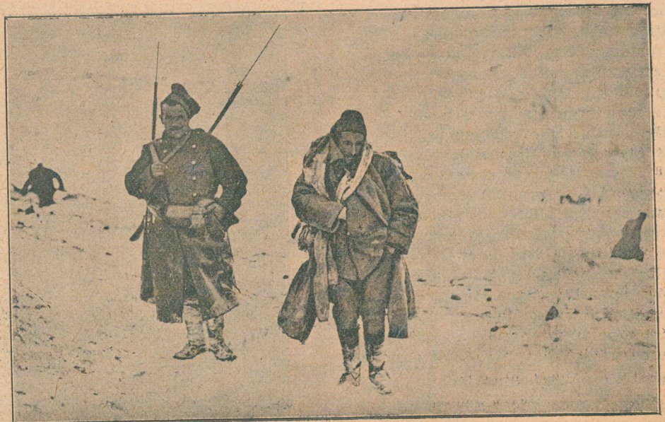
Заробљени турски низам у пратњи српског војника код Једрена

Него има непосредно поред Тарабоша још један врхунац по висини