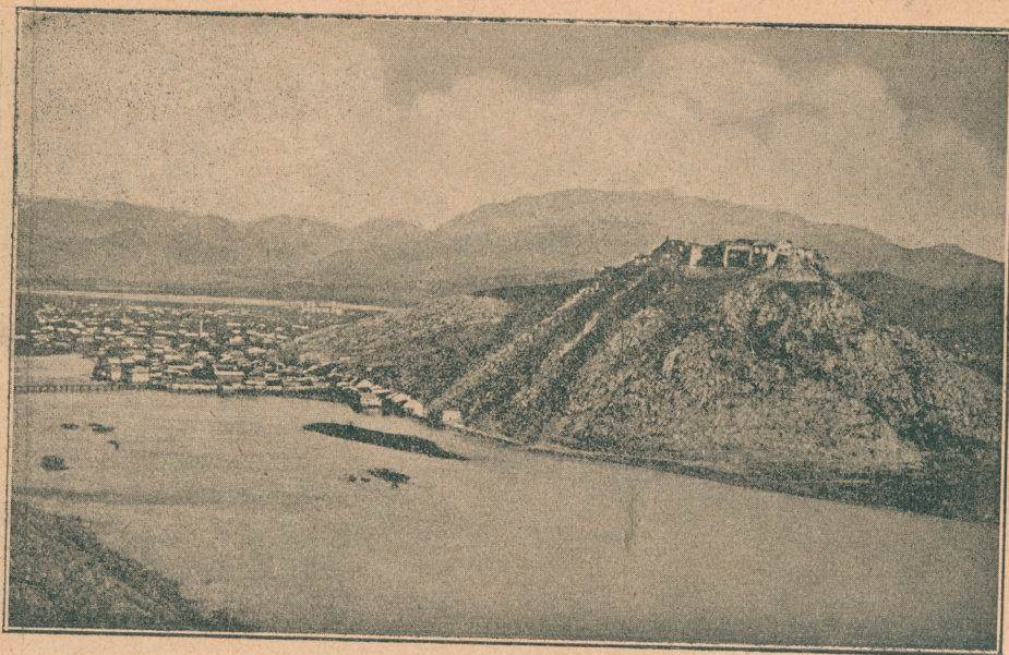
Скадар на реци Бојани

шта то има да значи. То је била тишина пред буру.