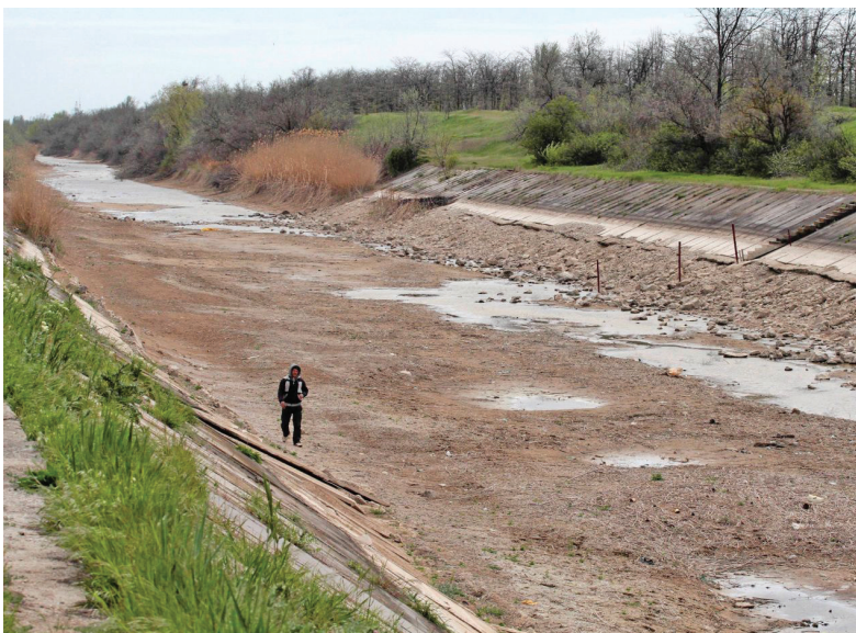
Північно-Кримський канал «до» і «після» закриття

ські свердловини, а також пробурити нові. Інші більш категоричні в оцінці нинішньої ситуації. Ними наводяться такі цифри. По каналу з Дніпра в Крим транспортувалася вода в обсязі 1 млрд кубометрів на рік. 80 млн кубів з цієї води спрямовувалося на поповнення водосховищ. До Другої світової війни, коли Північно-Кримський канал не функціонував, у Криму проживало близько 1 100 000 осіб. Нині населення сягнуло понад 2 700 000 осіб. 1 людина впродовж доби споживає – 3,3 кубометри води. Для порівняння: вирощування 1 бичка на забій – 100 тонн води. Після припинення постачання води по Північно-Кримському каналу проблему із забезпечення населення прісною водою тимчасово вирішили шляхом розконсервації підземних водосховищ. Однак баланс різко змістився і тепер рівень підзем-