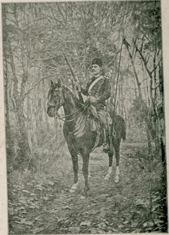
[ رسام خليل بك افندينيك اخيرا «لهدوق» مغازه سنده تشهير ايلدكاري تابلو ]