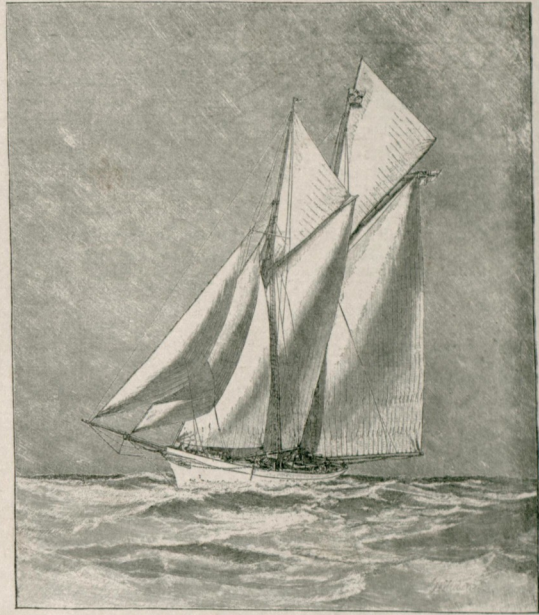
[ ایدونا قوطره سی ]

الماتیا ابراطوری حشمئلو کیوم حضرتلرنیک « ایدونا » اسمنده انشا ایدیردکاری قوطره درکه ۱۶۱ طونه جمنده . فرق برمتزو طولندهدر . بلکنلری شمدی په قدر انشا اولنان تنزه سفائتک جملهسه نسبة فوق العاده مزین و متین اولوب صنایع حاضرتهک الک صولک نغوته تکملی اراائه ایدر .