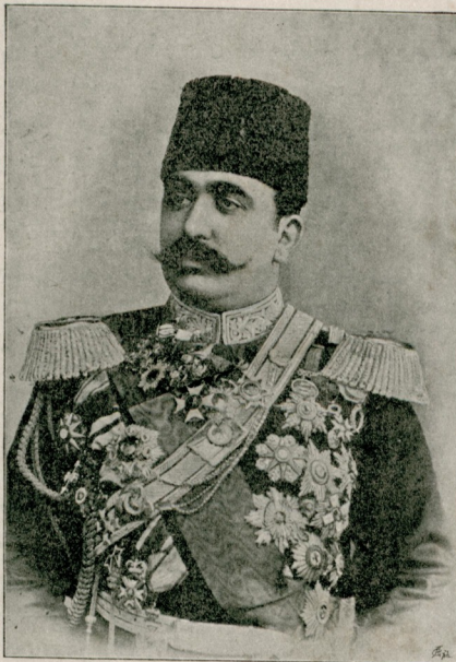
سلطنت سدیة عثمانیهک استوقهولم سفیر جدیدی سعادتلو شریف پاشا حضرتلری Son Exc. Chérif, Pacha Le nouveau Ministre de Turquie à Stokholm.

چهره تک صاحبنی کماله اندرر اولان معینداراغیدر . من غیر حد کلایورز که ذات عالیکز صنعت وسمک هر نوعدنه اثبات اهلیت ایتمش بر صور برهنرکنز . حمدی تک افدی .. احمد علی پاشا حضرتلری کچی ذات عالیکزکده وجو دکزله صنایع نفیسه عثمانیه قحار ایملیدر . — استغفره ! واقعا حمدی تک افدی .. احمد علی پاشا حضرتلری غایت ماهر .. غایت هنرلی رساملردر . آنلرک وجودلری ایله هپ اویخشار ادرز . بنده کزه کتجه .. بنده حالجه چالیشیوروم . فقط شهیدلک دها بیوک برسام رکم .