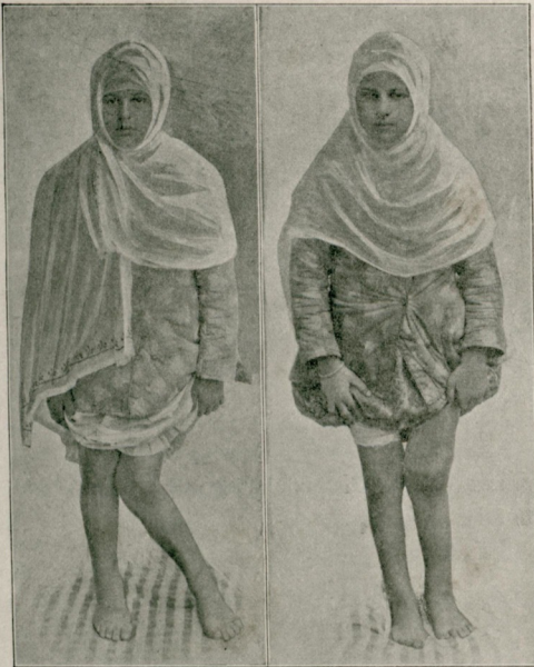
[ عملیات جراحیه ]