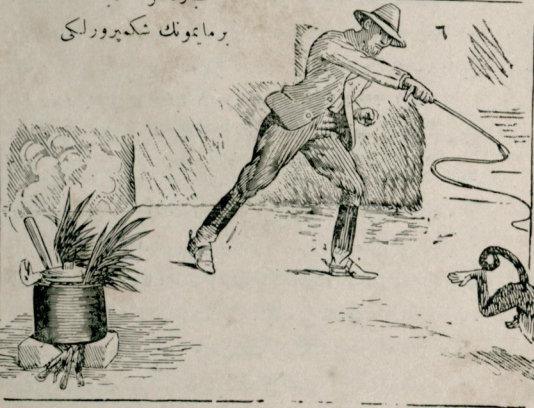
عبارهمسز حكايه : برمايتونك شكه پرورلىكى

صوكره ارسطونك اخلاف وتلاميذ نجه ايش بانقه فقه نظر دن كوريله رك بو سبتون باشقه بر صورت كسب ايش . حتى تاو فراست اساس تقيدى طارلاشدره رق تكامل صنعته حائل اولق ايسته مشدر . تاريخده اسكندريه مكتبي نامي و بريان دوره كلنجه ، بو فكرده يكلكدن زياده سحر آرا منجه برابر تاريخ تقيدده يه مهم بر فصل اشغال ايديبور .