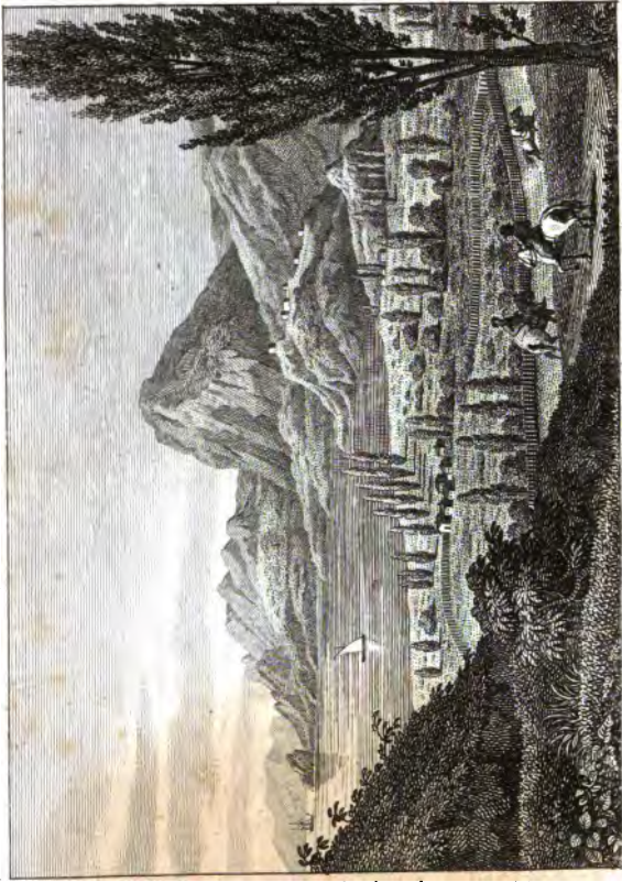
Рис. от гравюры И. Гамалева.