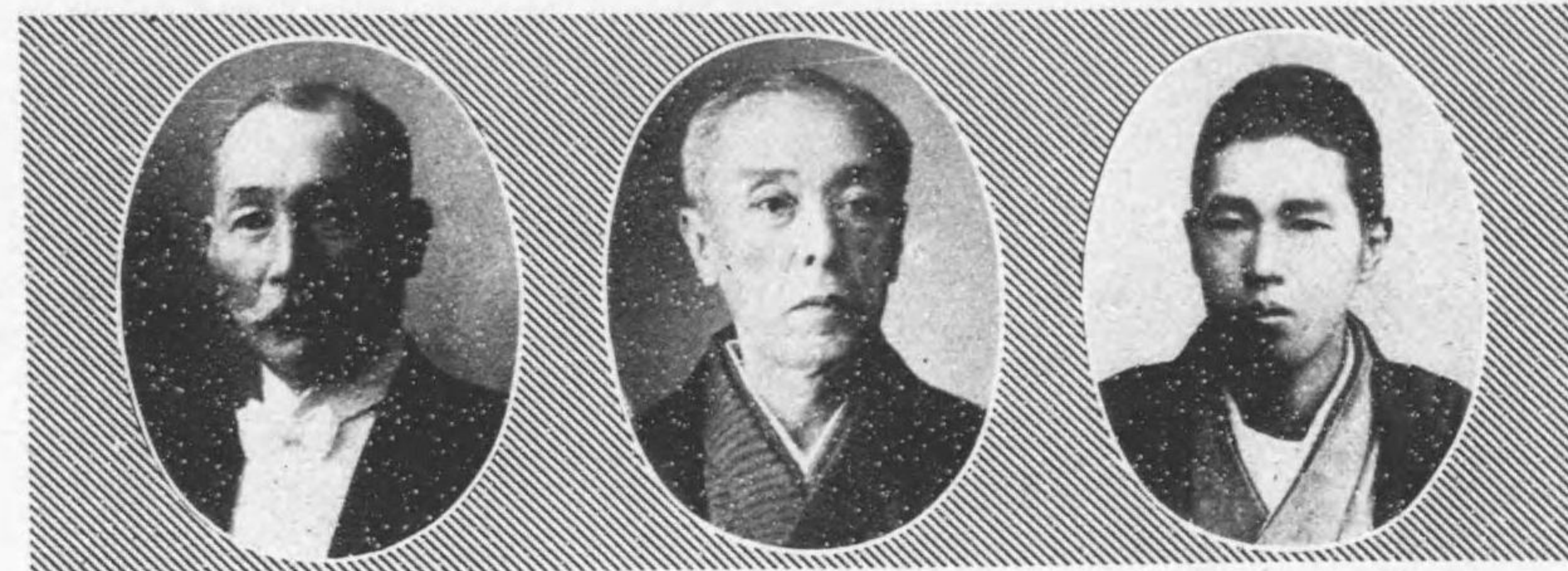
氏郎三間本 日七月十年四十三治明自 期二第 日六月十年六十三治明至