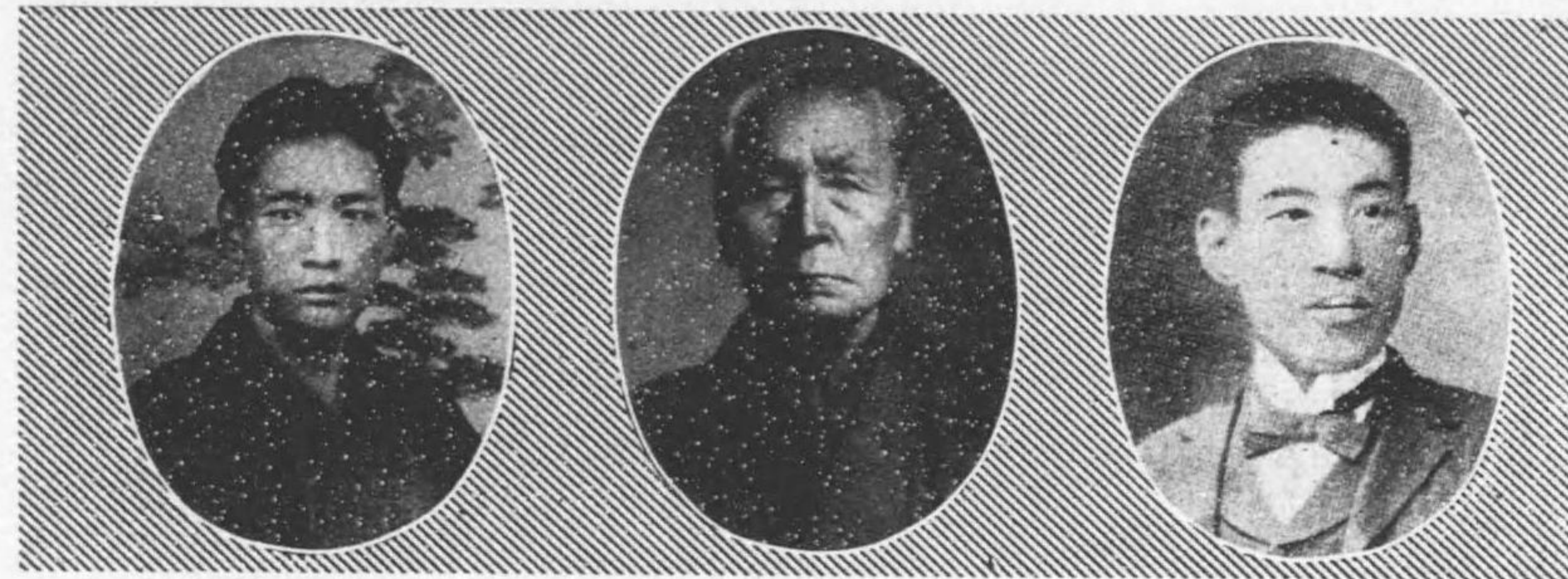
氏三六上井 日十二月七年九十二治明自 期一第 日七月六年十三治明至