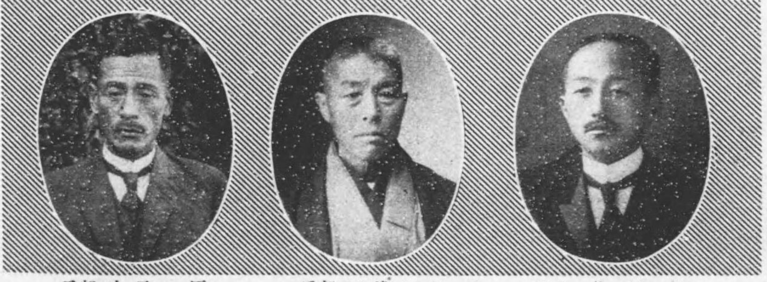
原元太郎 日七月十年八正大自 期六第 日六月十年八正大至