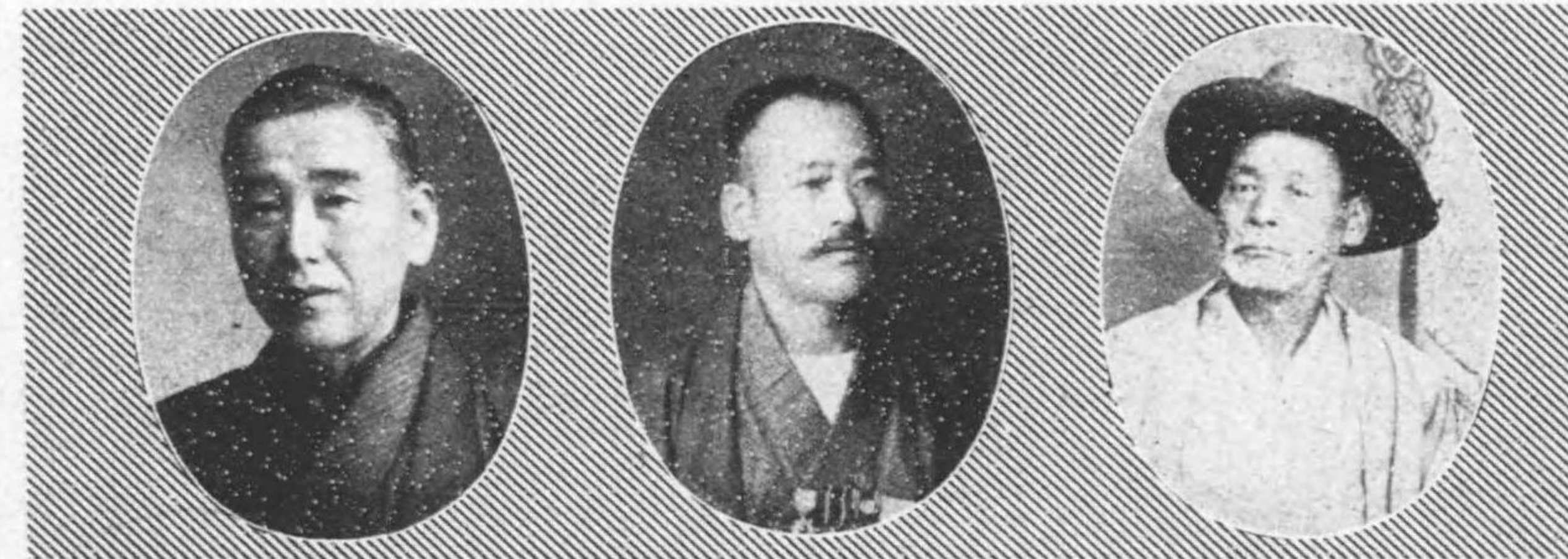
氏郎七傳原杉 日七月十年四正大自 期六第 日六月十年八正大至