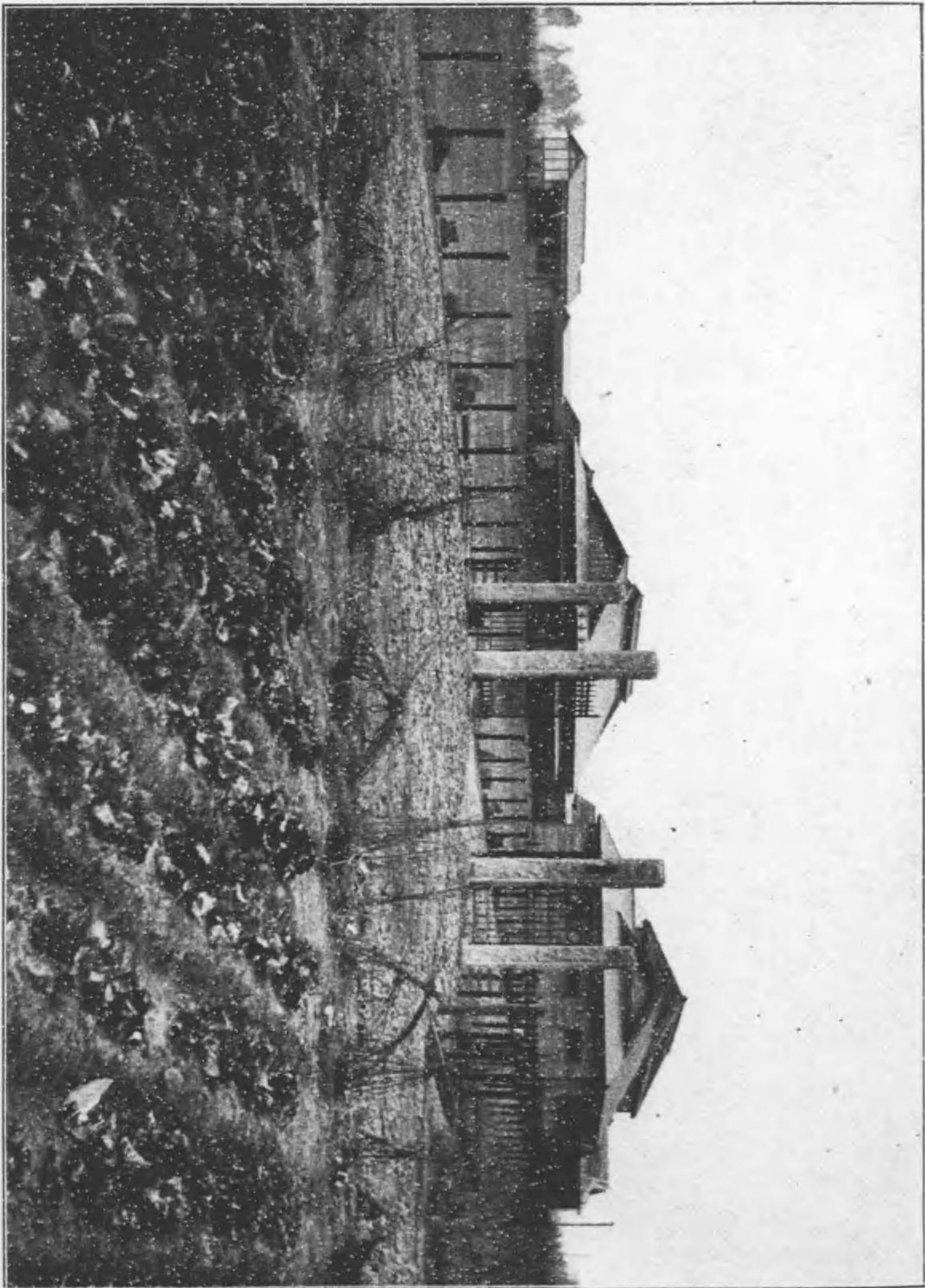
群馬縣佐波農學校