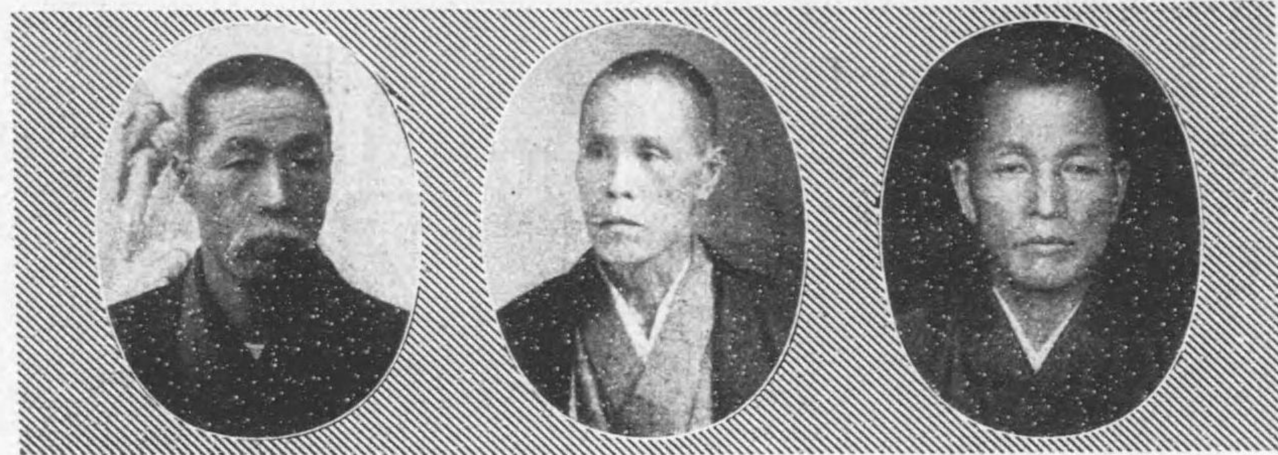
氏郎十源田栗 日七月十年十四治明自 期五第 日六月十年四正大至 日七月十年四正大自 期六第 日六月十年八正大至