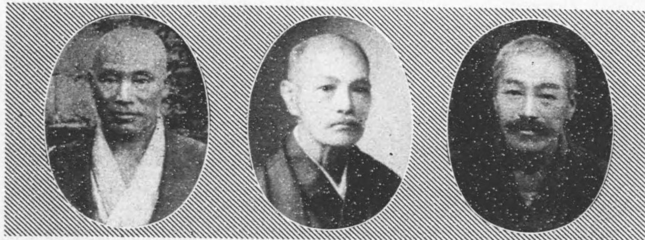
氏東右村西 日十二月七年九十二治明自 期一第 日六月七年二十三治明至