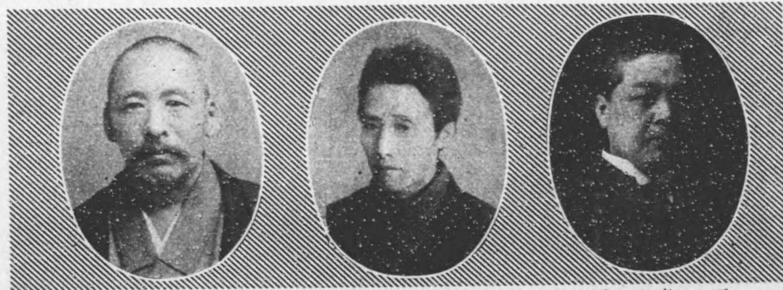
氏郎五祐柳高 日七月十年二十三治明自 期二第 日六月十年六十三治明至 日七月十年六十三治明自 期三第 日三十月六年九十三治明至