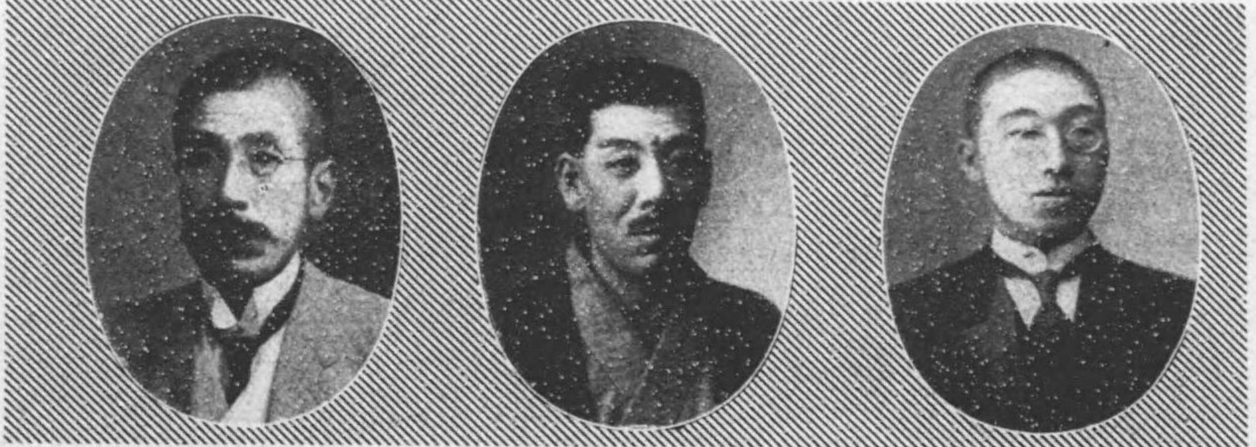
氏郎太雄島中 日七月十年十四治明自 期五第 日六月十年四正大至 日七月十年四正大自 期六第 日六月十年八正大至