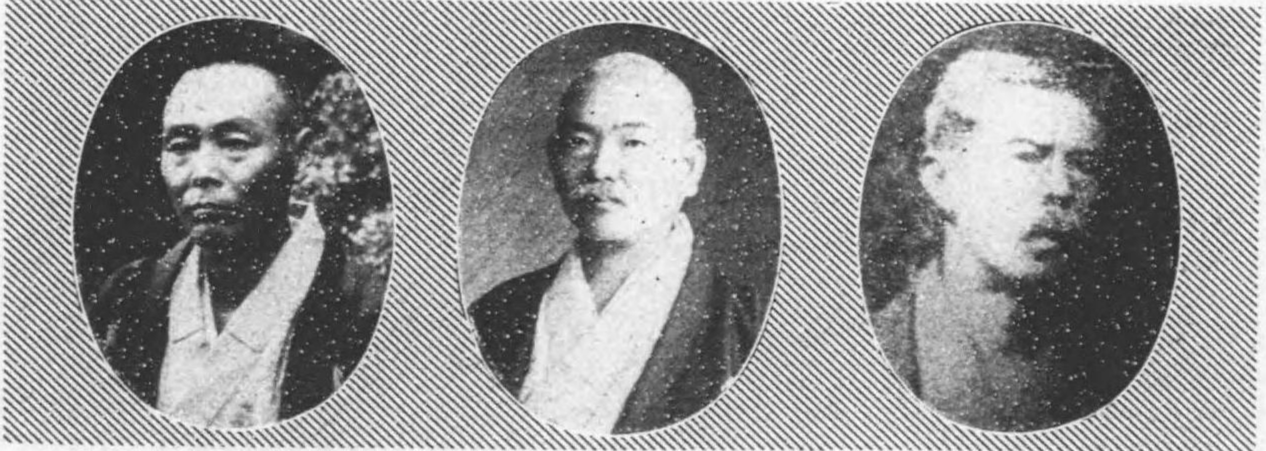
氏平茂本岡 日七月十年十四治明自 期四第 日六月十年四正大至 日七月十年十四治明自 期五第 日六月十年四正大至