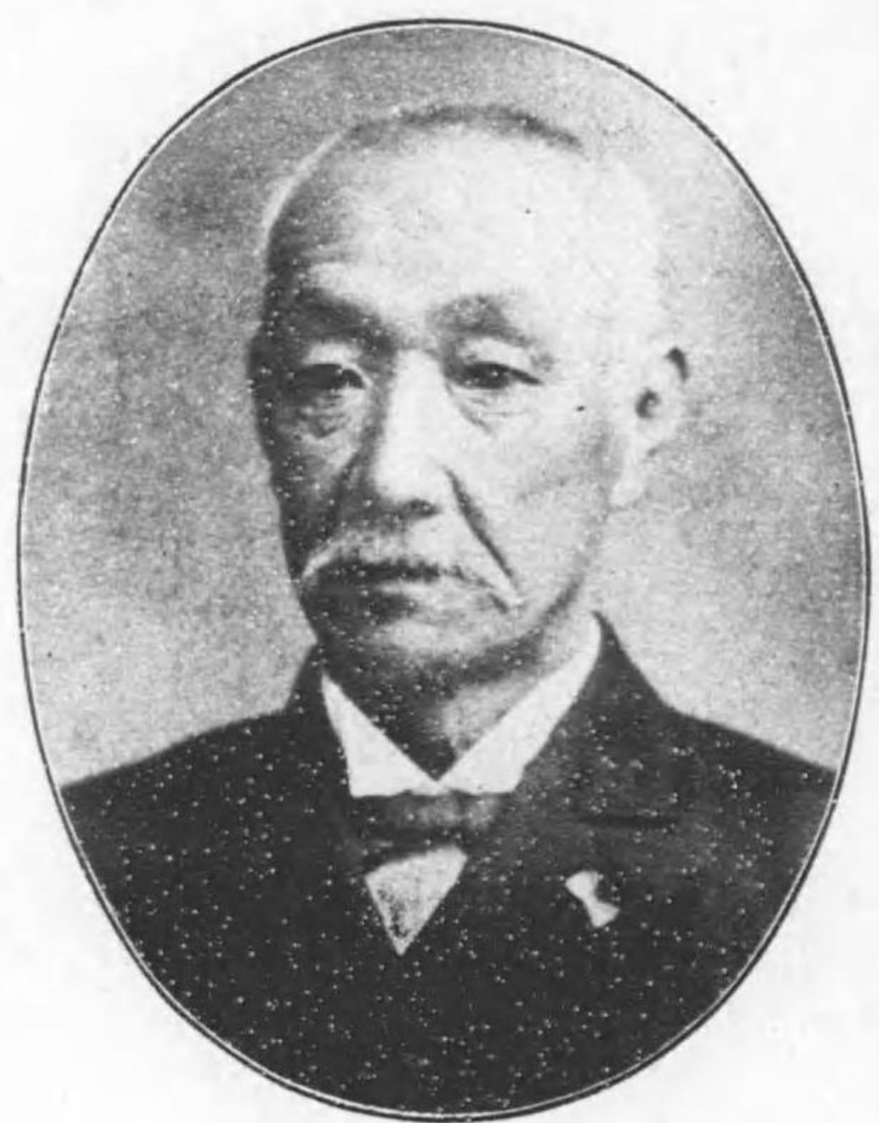
石原 藏 藏