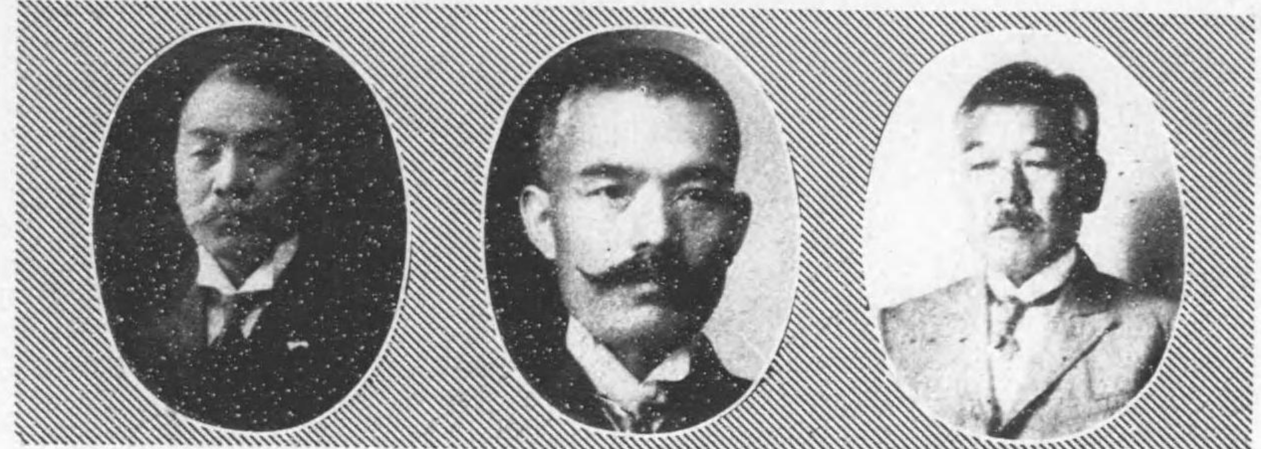
氏平清橋高 日七月十年十四治明自 期四第 日六月十年四正大至 日七月十年十四治明自 期五第 日六月十年四正大至