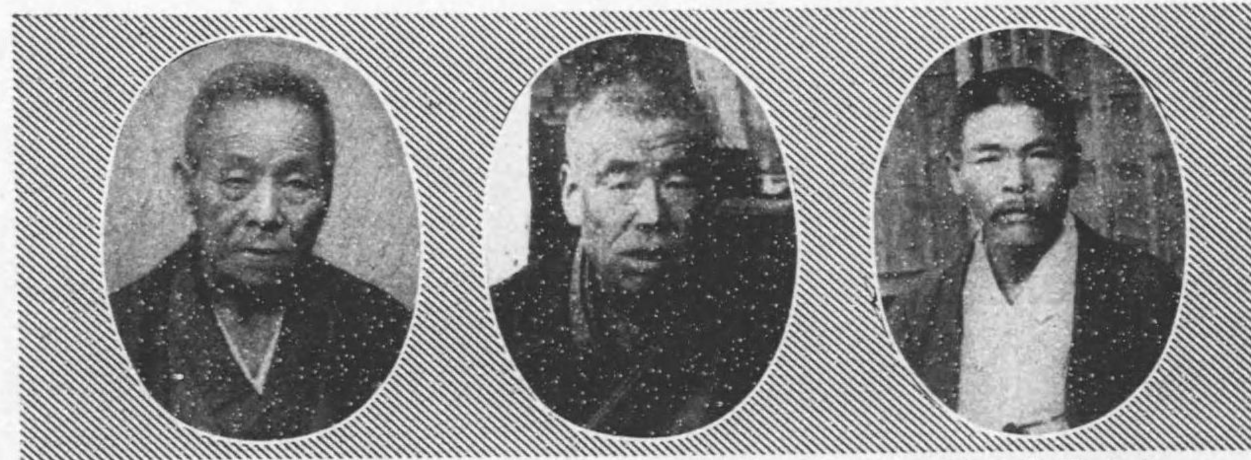
氏作庄井石 日七月十年二十三治明自 期二第 日六月十年六十三治明至