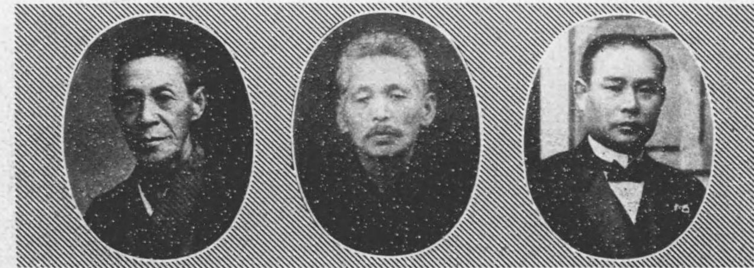
氏三連城下 日七月十年四正大自 期六第 日六月十年八正大至