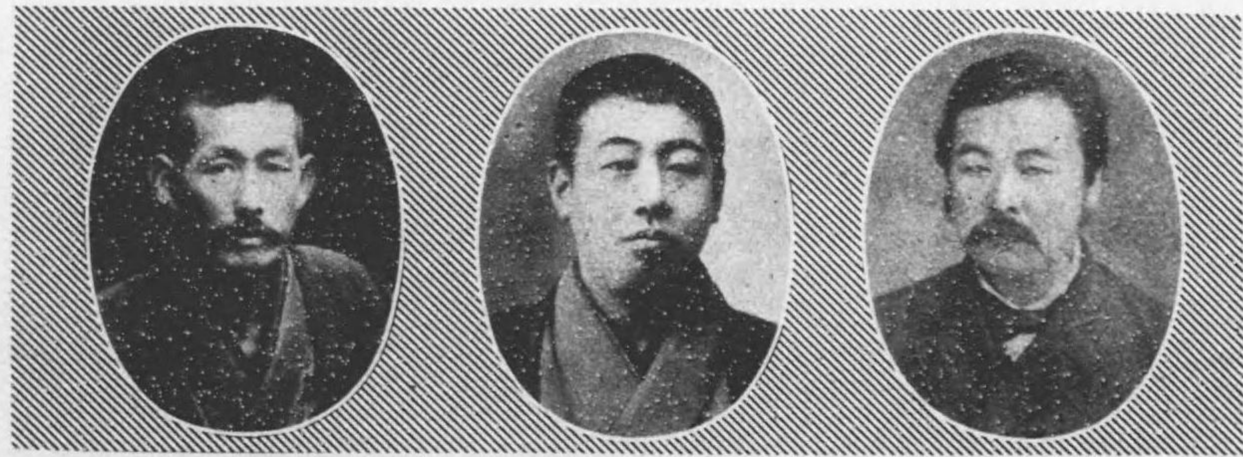
氏作良澤梅 日十月九年一十三治明自 期一第 日六月七年二十三治明至