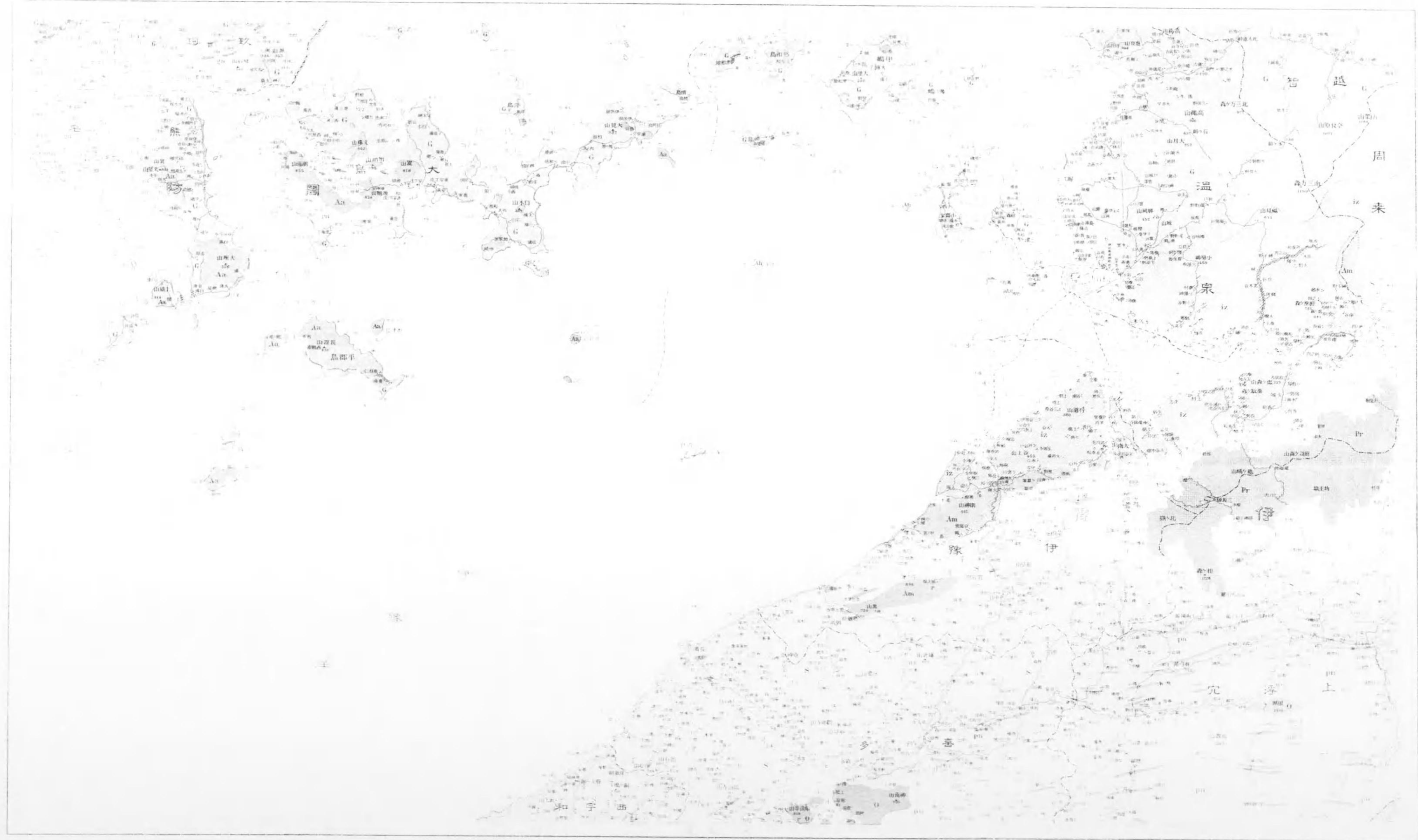
限 畫 雜 留 埒