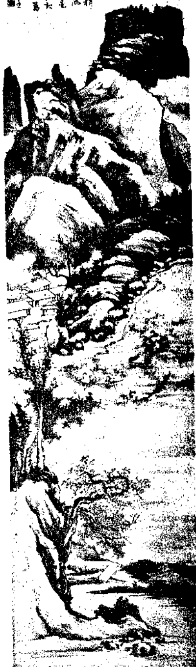
Landscape By Li Wu Hu

李五湖山水畫，其筆墨淋漓，氣韻生動，誠為畫中一絕。其畫中人物，亦各具神態，令人賞不勝賞。其畫中景物，亦極其生動，令人如入其境。其畫中氣韻，亦極其生動，令人如入其境。其畫中人物，亦各具神態，令人賞不勝賞。其畫中景物，亦極其生動，令人如入其境。其畫中氣韻，亦極其生動，令人如入其境。