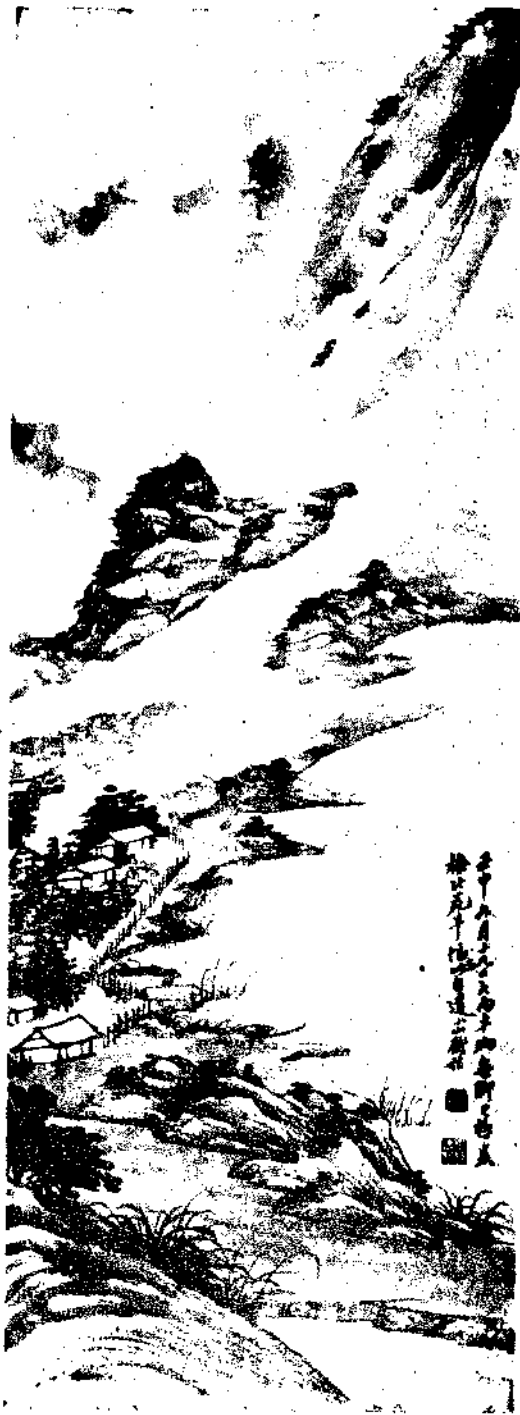
Landscape By Wang Sheng Hu