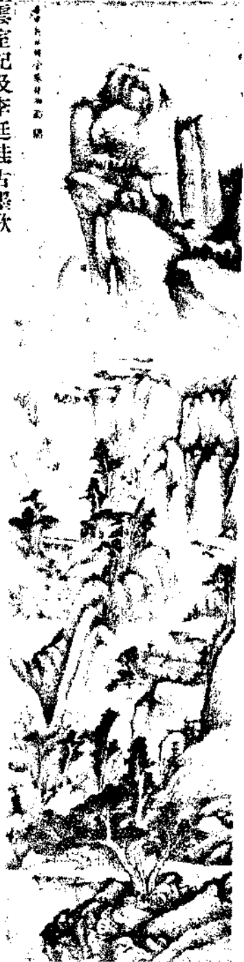
Landscape By Tsai Chu Ang