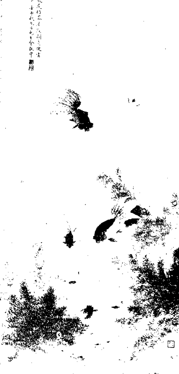
Gold Fish By Chin Chih Hu