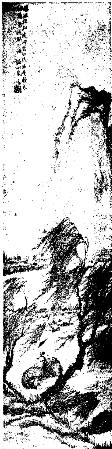
Landscape By Chu Shen Lan

天香 蘭蘆儿上香灰結字同 邕威韻 湘押通簾吳杯倦酒沈冥 遠恨難寄鏤戶風微籠紗 煙靚幻出半鬢芳思拘蓮 不斷慵未結同心靈蒂餘 潤偷分鏡汐迴文暗縈機 字 溫磨更假翠被總無