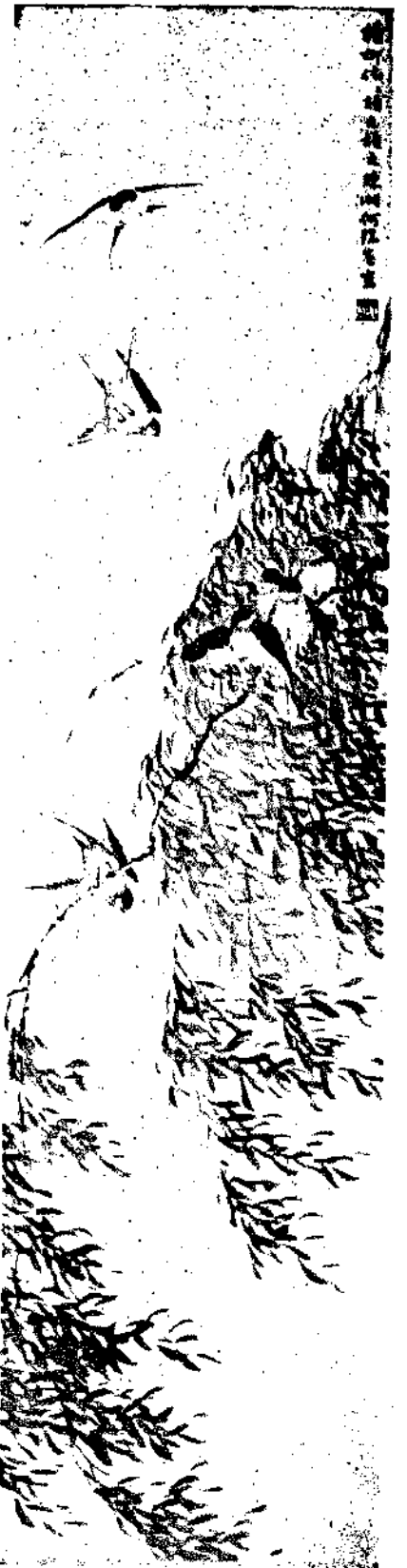
Swallows By Ho Lien Hu