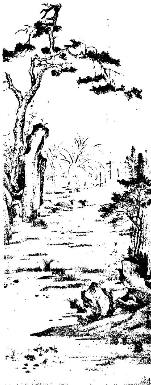
Landscape By Wang Chien Hu