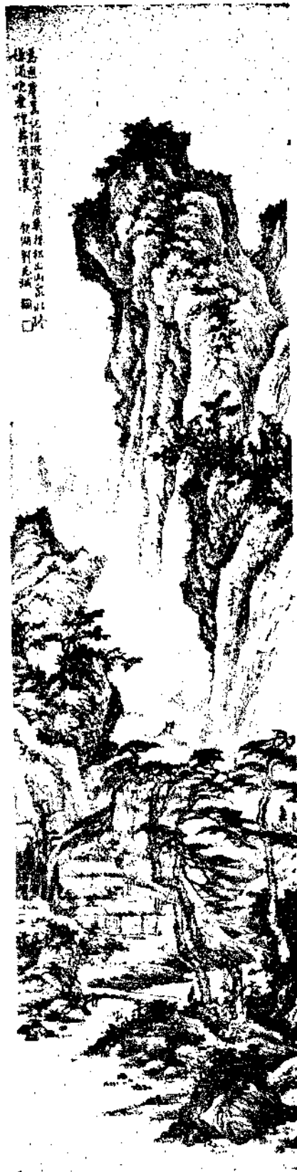
Landscape By Liu Ying Hu

與張僧繇、曹仲達、吳道子為簡人四典型之一。尚書右丞王維。自謂前身詞客。宿世畫師。實