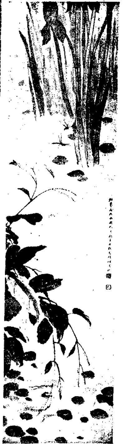
Flowers By Wang Ying Hu

簾捲知有人家住水西 菊花墨竹贈齊白石 贈君黃金珮佐以青琅玕君應 識此意相期保歲寒 歲朝圖 年果唐花色色殊松清梅瘦水 仙癯屠蘇飲罷桃符換自寫春 盤獻歲圖 (未完)