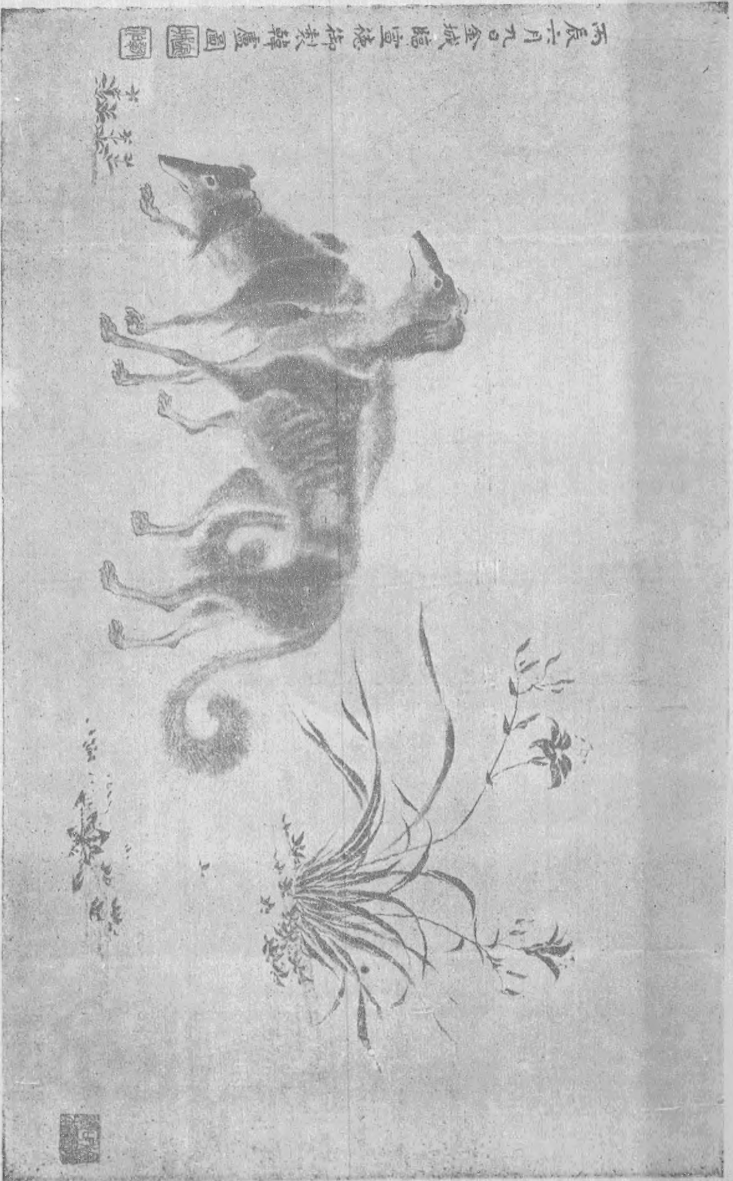
Dogs By Kungpah T. King