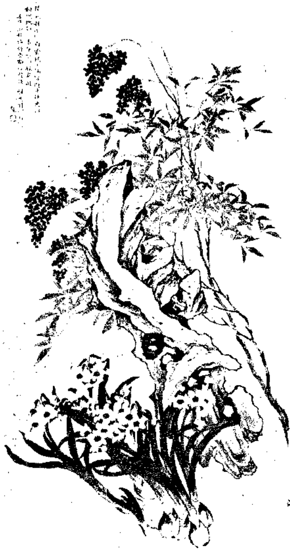
Flowers By Chung Chih Hu