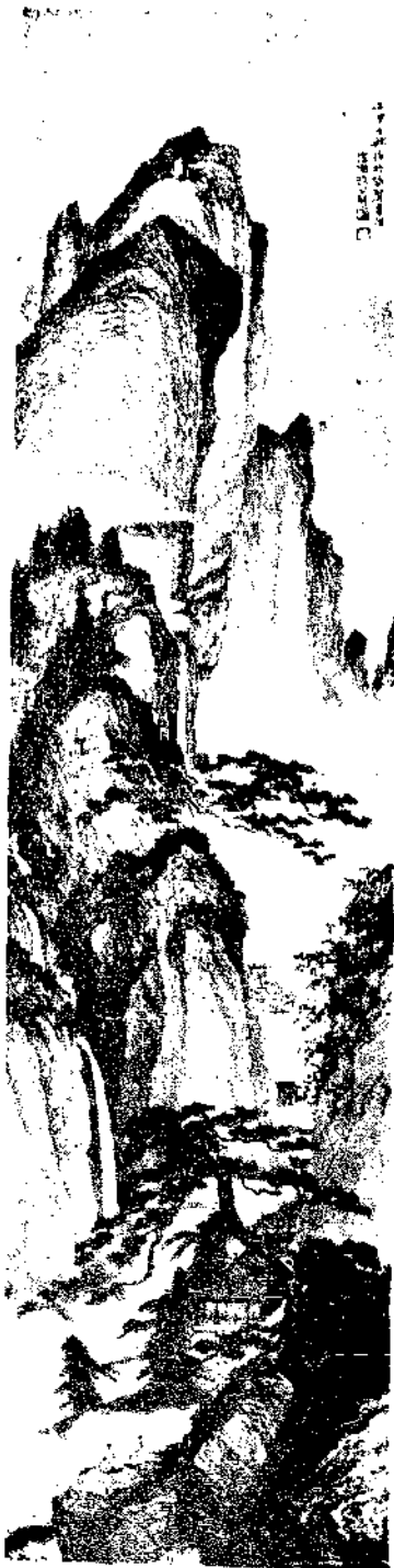
Landscape Tung Chen Hu