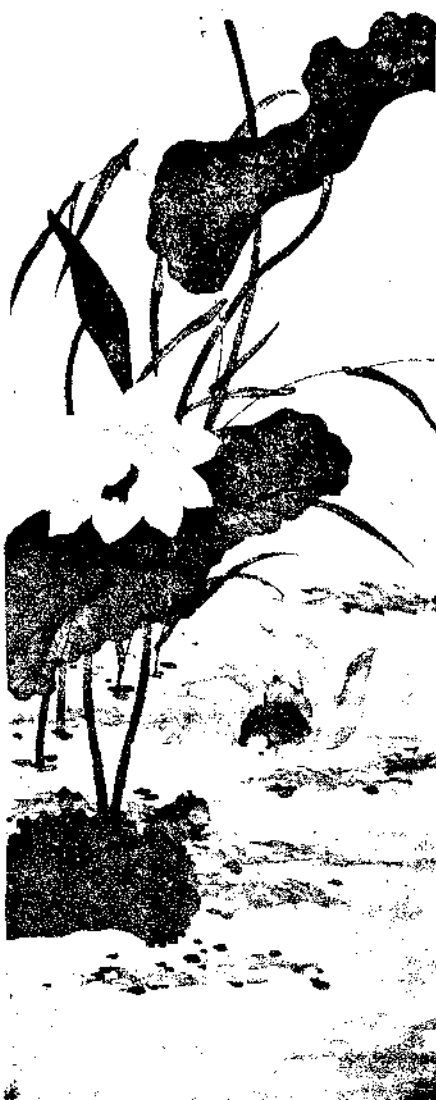
Lotus and Gold Fish By Miss Kuo Chao. Hu

Painting and Writing By Miss Kung Yong Hu.