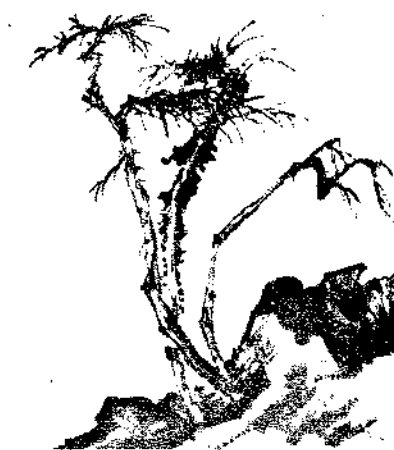
Landscape By Chen Shu Kuei