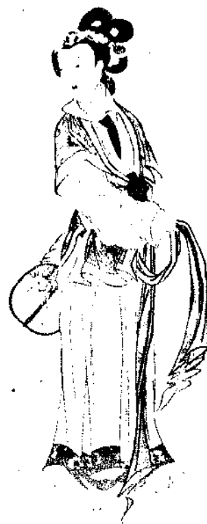
Lady By Miss Yang Su Hu