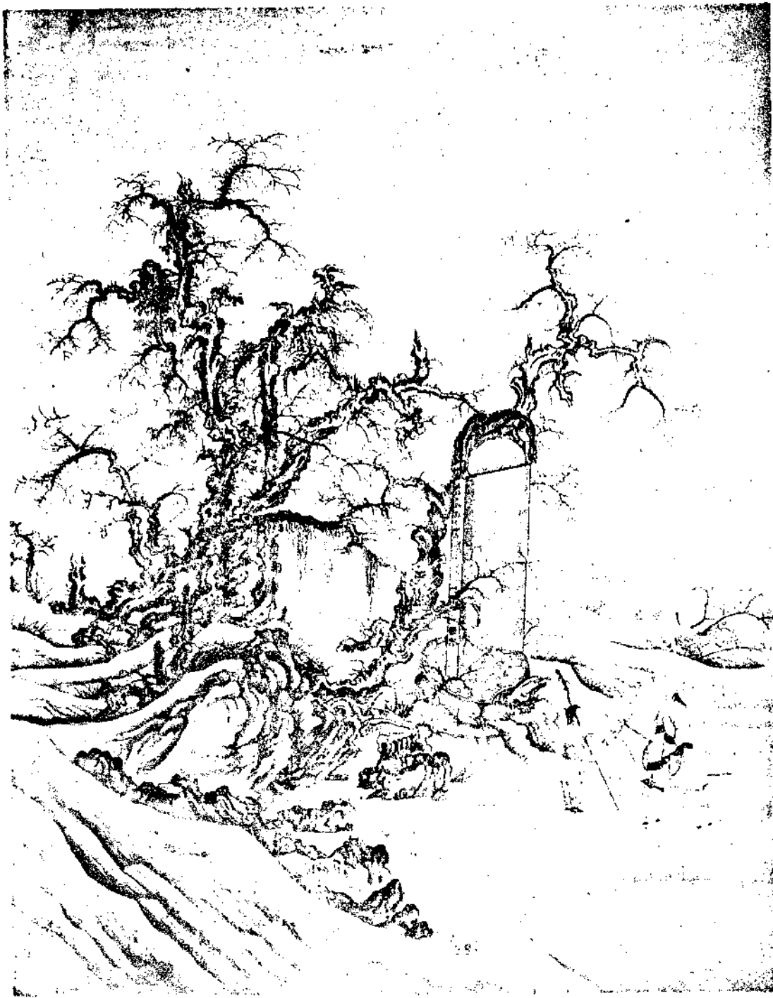
Landscape By Chang Chan Hu