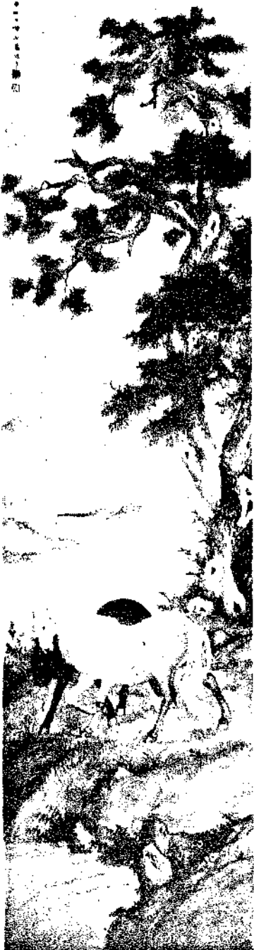
Horse By Kao Hsueh Hu