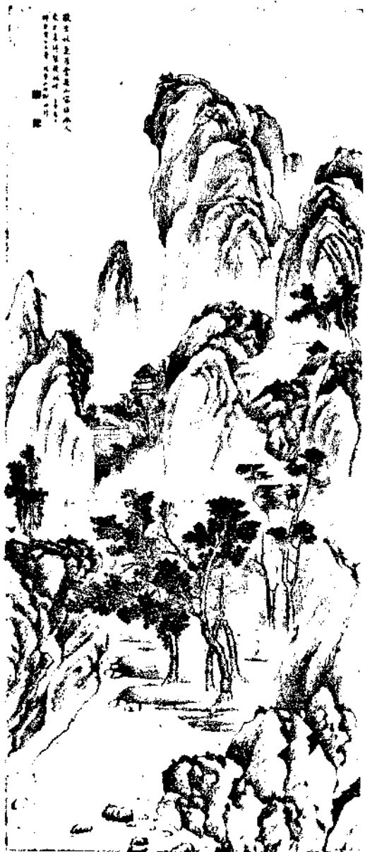
Landscape By Shao Mao Hu