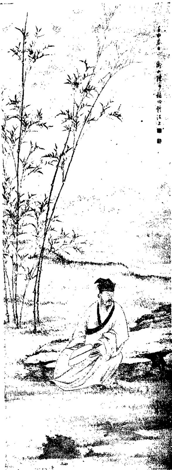
Hunan Figures By Chen Shang Hu

端巖重能試莫遣遊塵飛 動一痕輕際寸寸寒灰撥 起怕撩亂幽窗昨宵意悄 轉春魂紅蕩火細 柳梢青