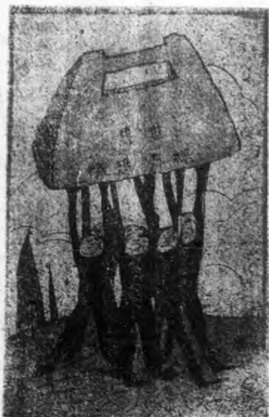
大家漸漸的支不持不住了

調查統計者，平均全世界每二十八人中，即有一人失業，去年失業總數已達二千五百萬人。連依賴失業者為活之人合計，則全球有六千萬乃至七千萬人之多。這樣自然影響到各國財政的收支，現就戰前及戰後各重要國家的財政收支，據世界政治經濟年鑑，可以看出美法英德意各強國近三年來，除法國外，沒有一國不虧空的，圖中(十)符號，是表示盈餘；(一)符號乃表示虧空。