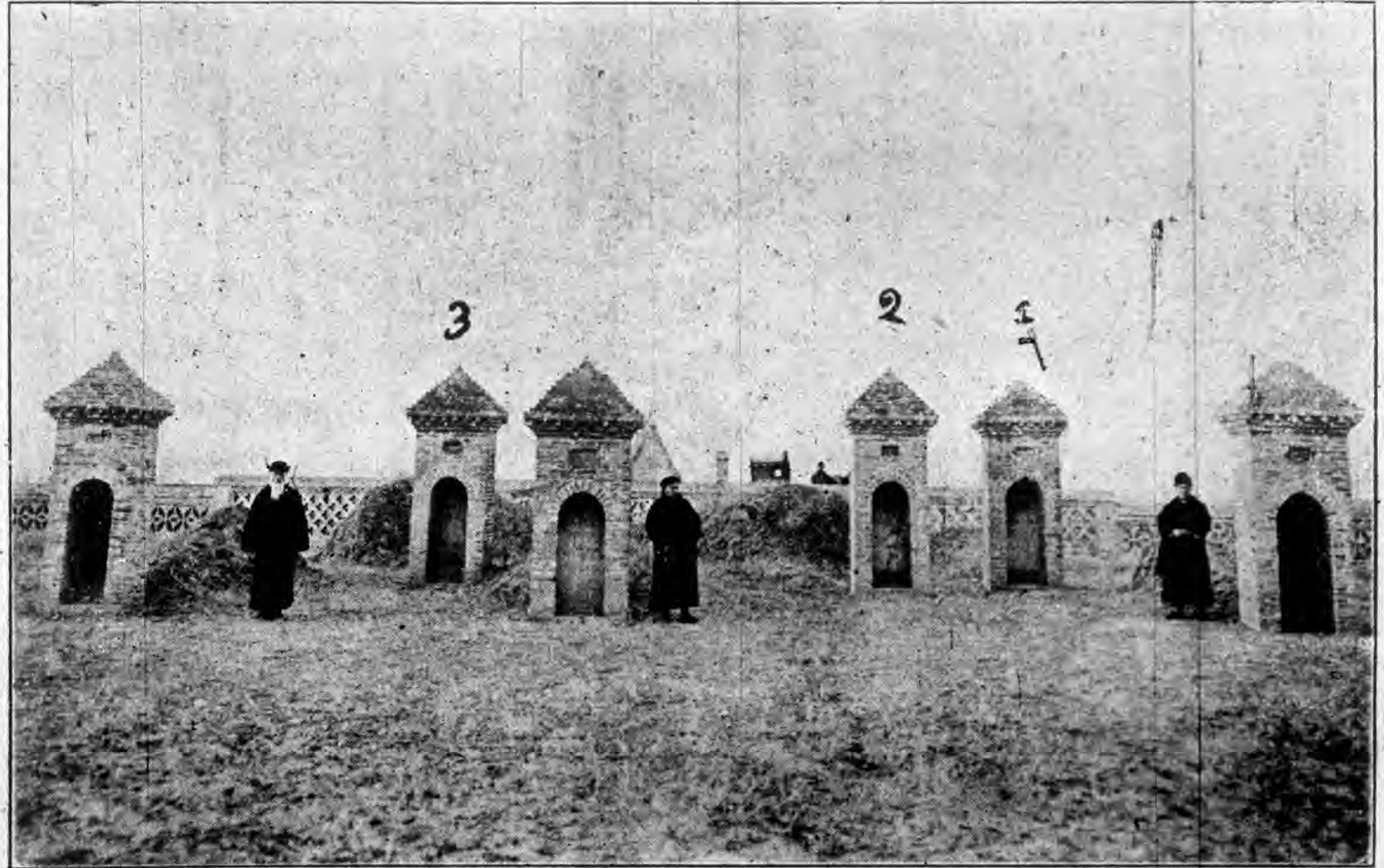
墓其為西坊碑格理恩 3 墓其為西其坊碑志一高 2 墓碑教主吳籍意 1