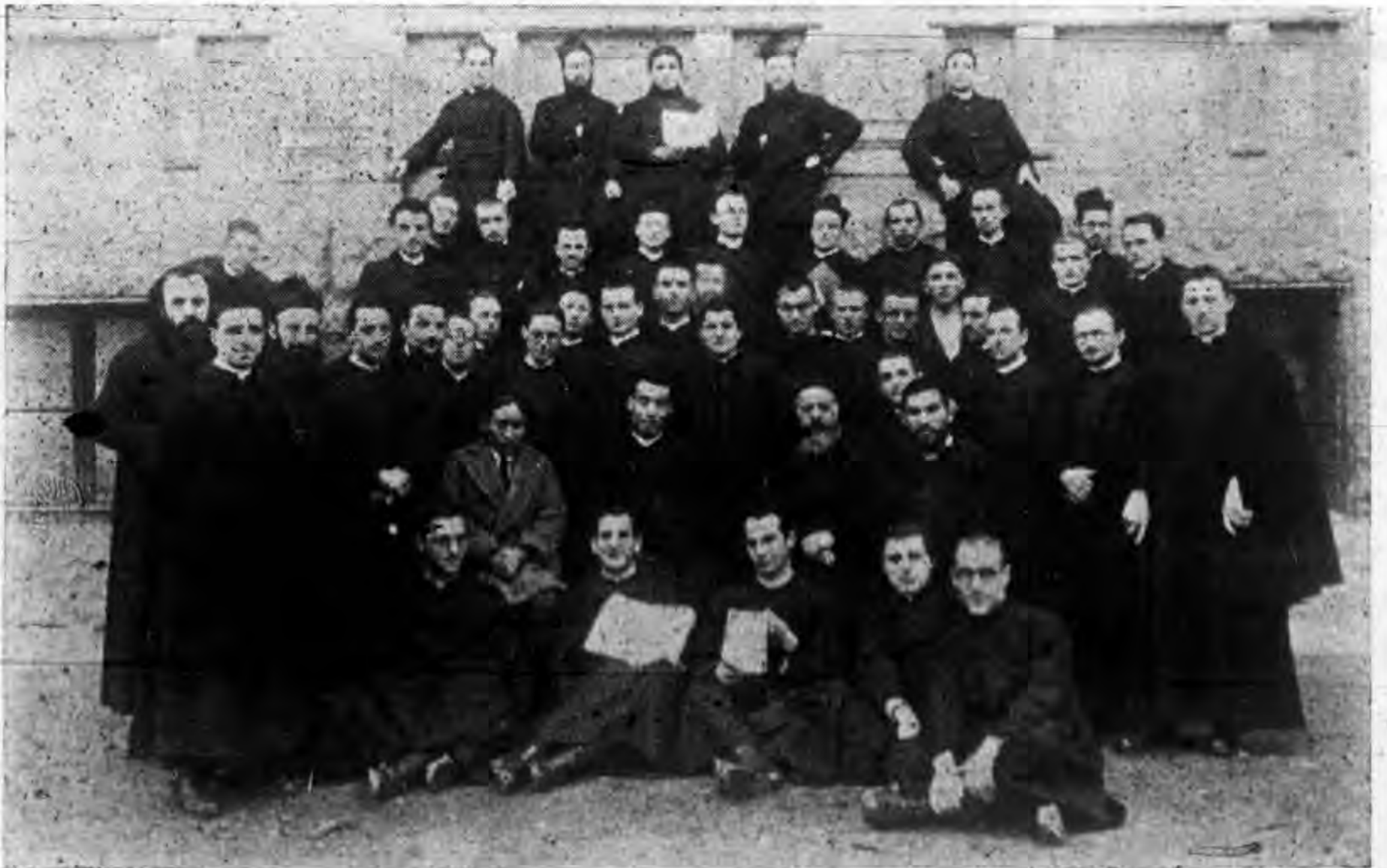
鐸司鐸警張迎歡院修大郎米國意