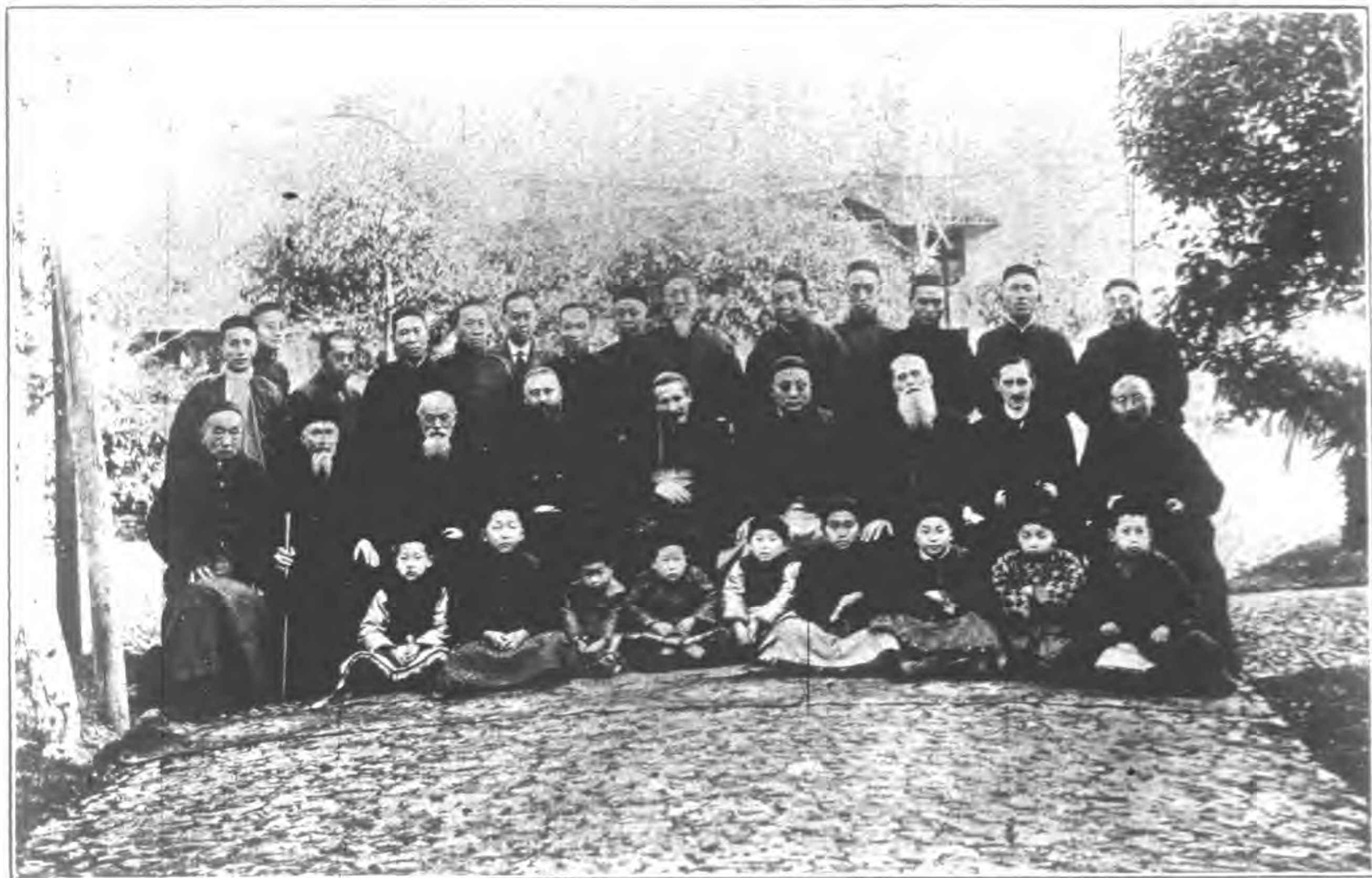
影攝堂育普新海上在公剛使欽宗教