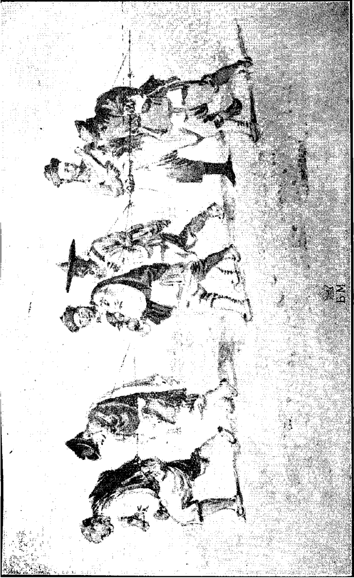
夫 纒 船 貢 國 英