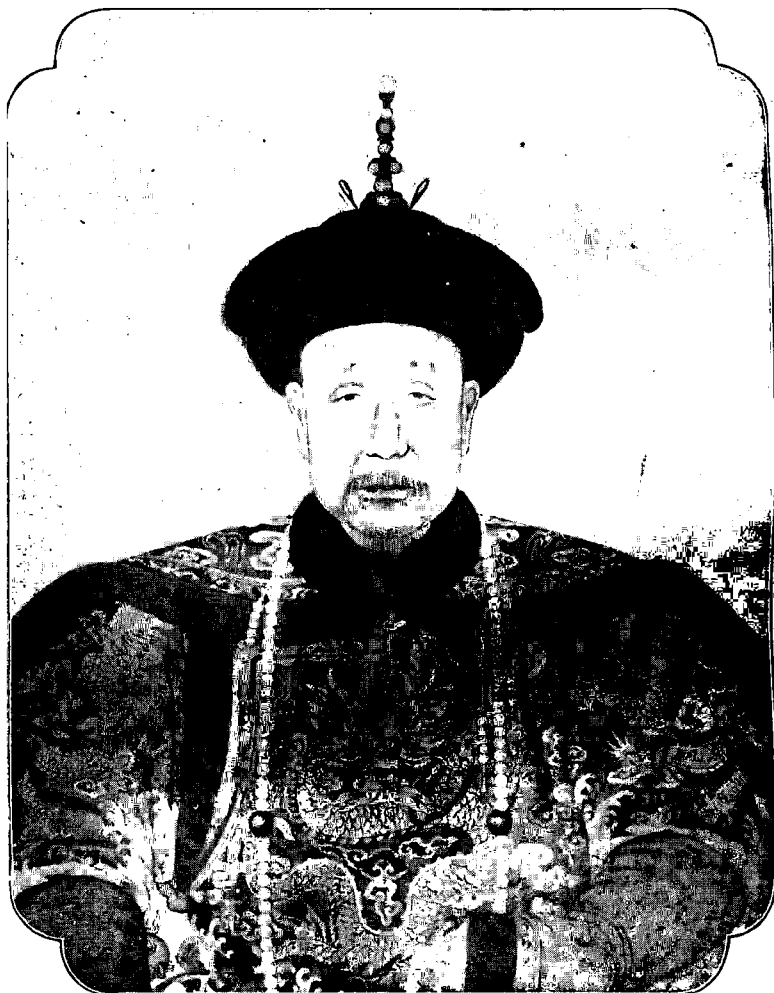
( 帝 隆 乾 ) 宗 高 清