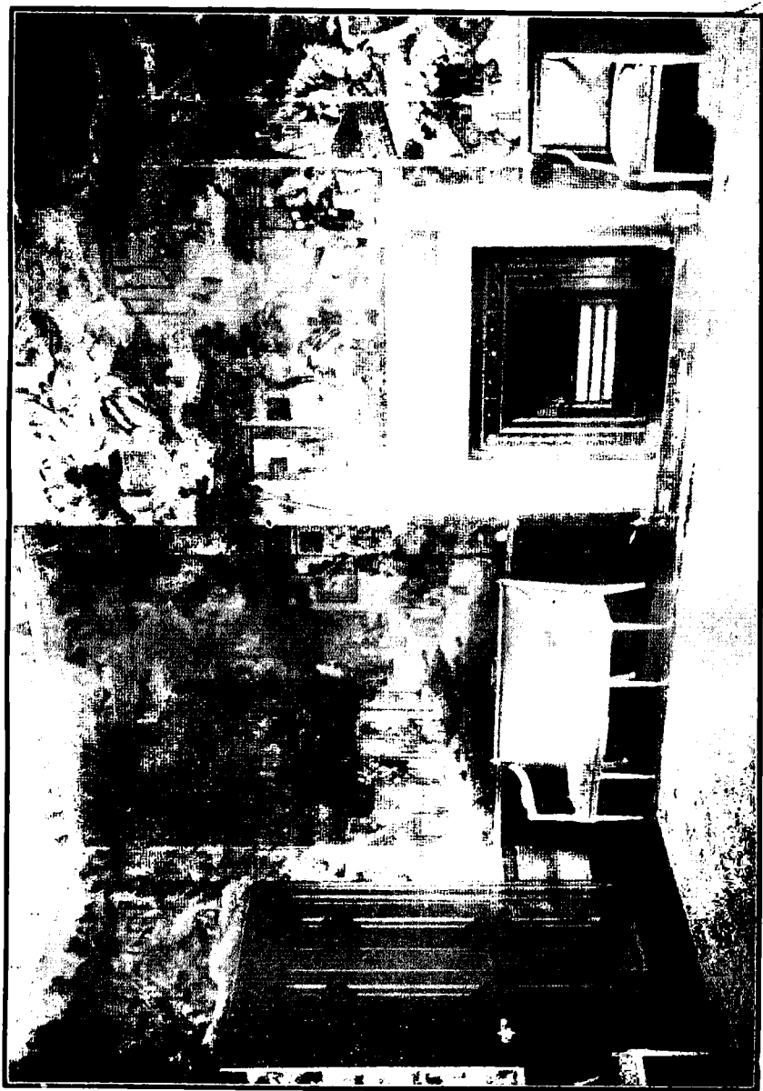
英使在中國所購之畫回英後作用壁飾