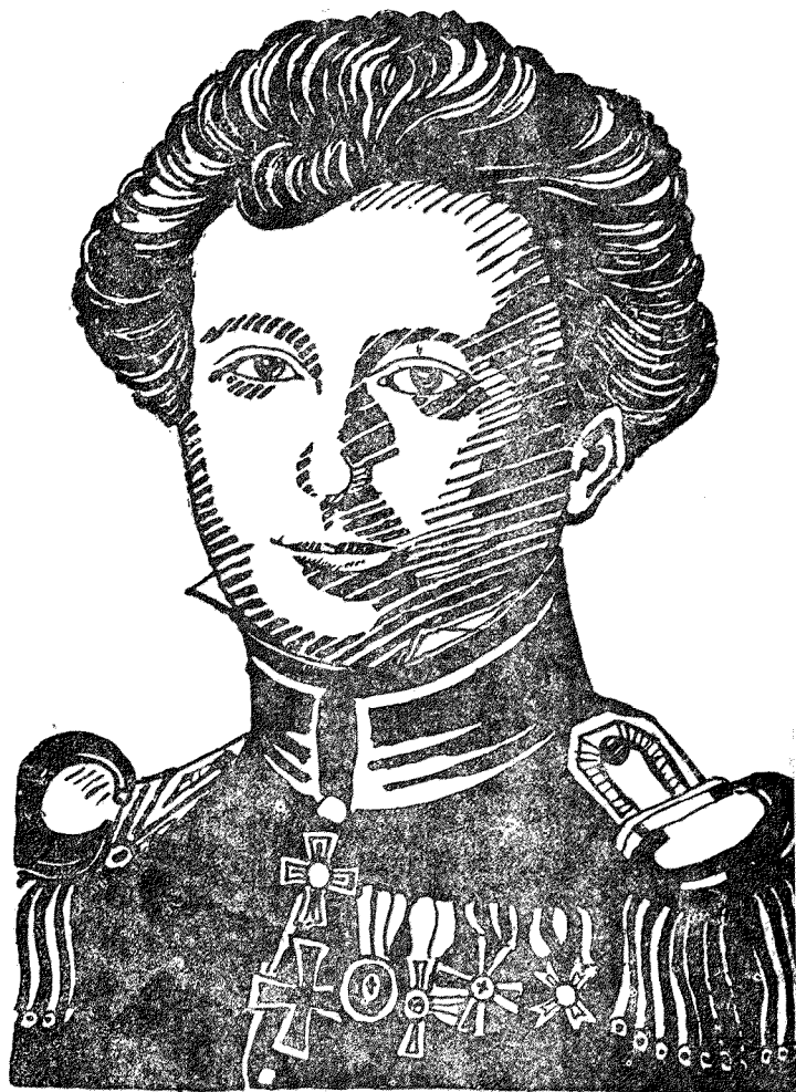
克勞塞維茲將軍肖像