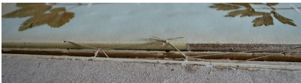
Fig. 3. Rośliny użyteczne... przed konserwacją. Widoczne rozluźnienie nici i uszkodzenie grzbietu