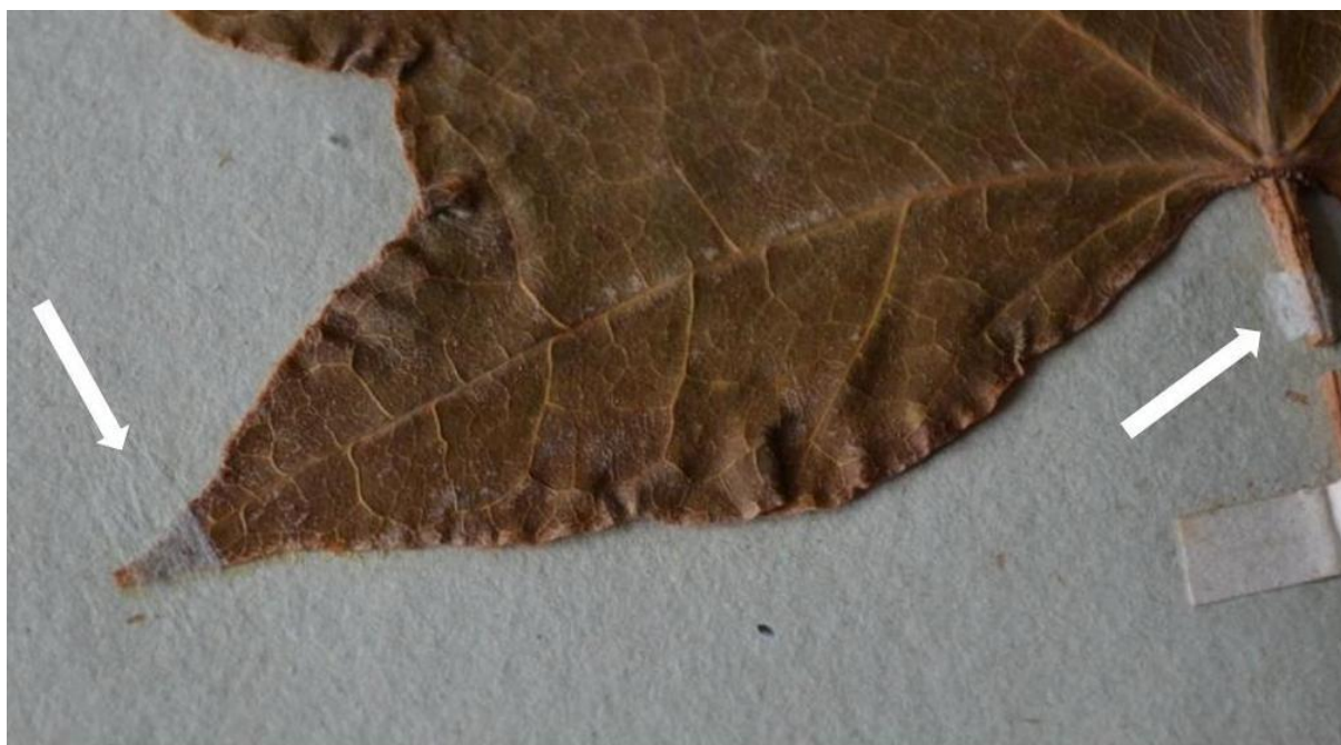
Fig. 2. Fragment okazu zielnikowego po konserwacji. Strzałkami wskazano miejsca dodatkowego mocowania bibułką japońską