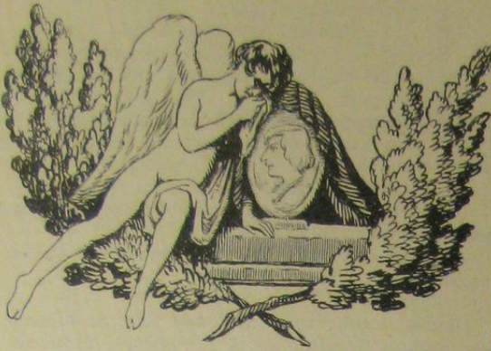
Рис. А. Р.