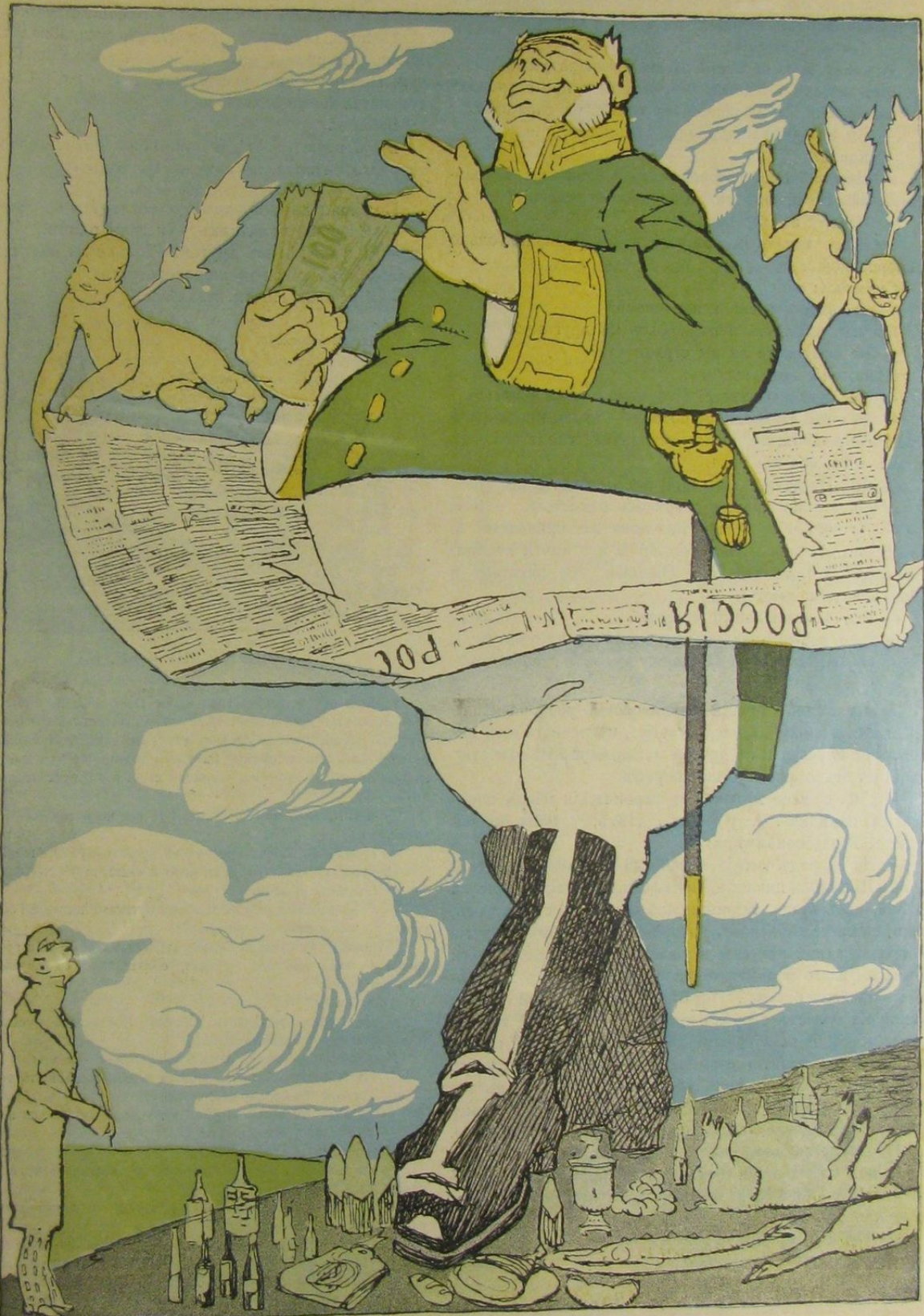
Тынь Гоголя (городничему). — Эге-ге! Да и разросся же ты, братья... Теперь даже мы, пожалуй, тебя не описать.