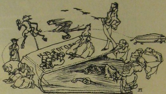
Рис. А. Яковлева.