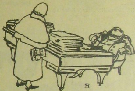
Рис. А. Яковлева.