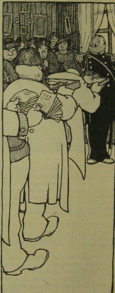
Рис. А. Юнгера.