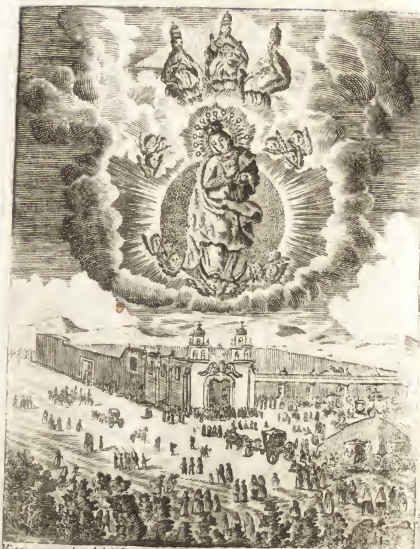
Vista y perspectiva del SANTUARIO D. N. SRA. DE LOS ANGELES en Mexico: cuyo aumentar se dev. à la divi. prov. y piedad de los bien echeros en el corto tiempo de qu- tro años q' un corrido, desde el a. de 1776. en q' se promovió esta devocion hasta este de 1780. en q' sus 200. años dl. origen de la Sta. Imagé y 85. d. la crecion e Capilla sup. de ella.