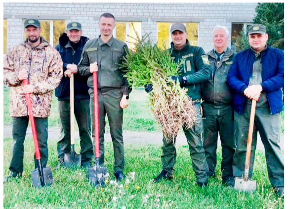
ДП «Макарівське лісове господарство»