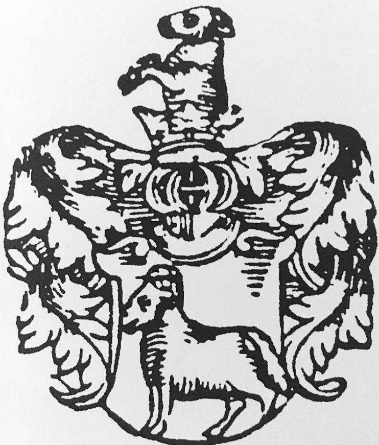
Герб Росцішевських Юноша