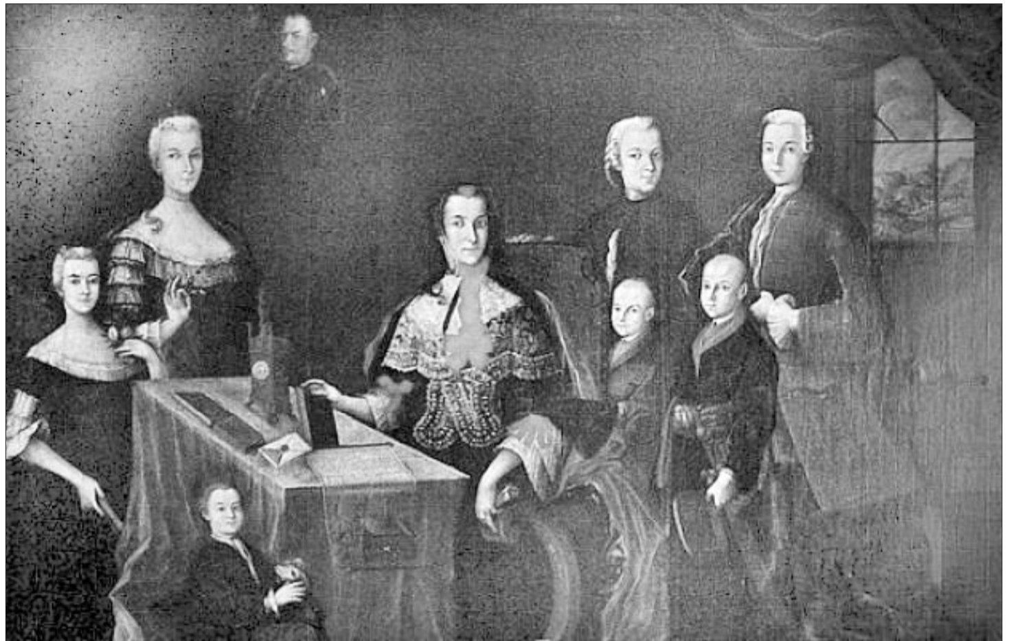
Портрет сім'ї Красицьких