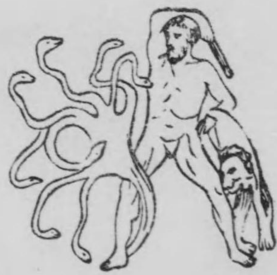
西 洋 之 怪 物