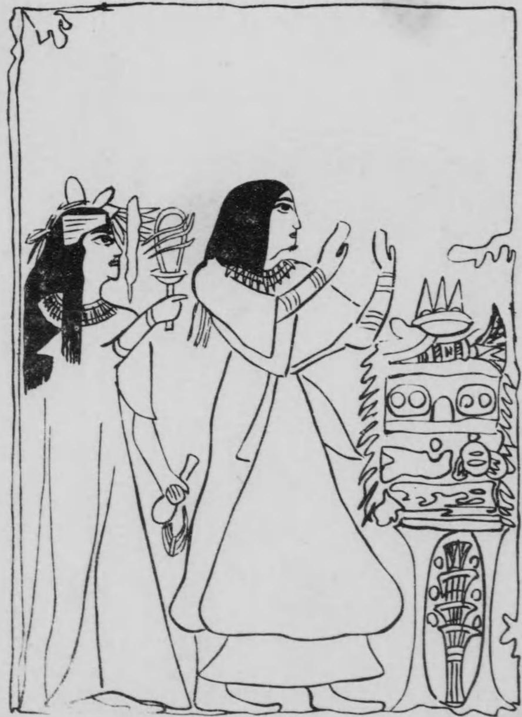
(畫古及埃) 圖の神拜