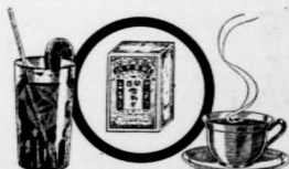
ICE TEA FOR HOT DAYS · HOT TEA FOR COLD DAYS 渴解暑消飲冰 腦醒神提飲熱

理 經 總 洲 美 司 公 貨 雜 行 輔 FOO HUNG COMPANY LTD. 129-131 PENDER STREET EAST Phone Pacific 6635 VANCOUVER, B. C. CANADA