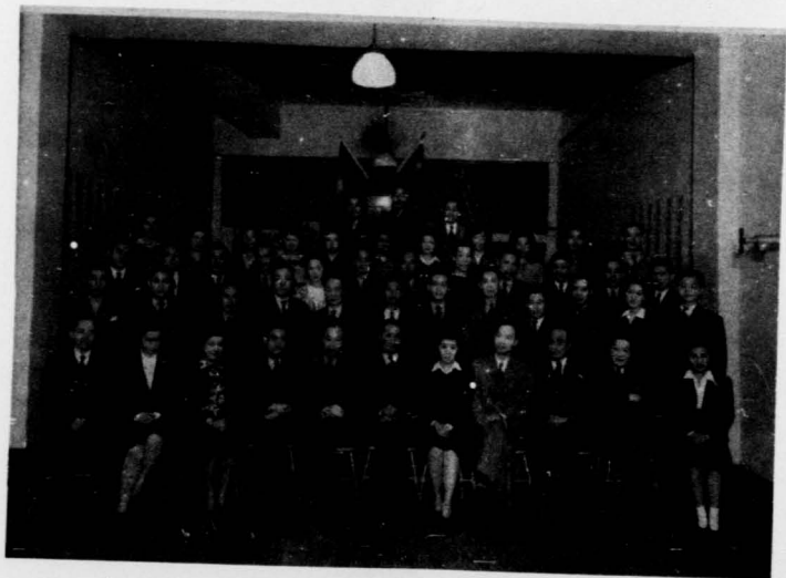
生 員 體 全 班 語 國 部 團 分 華 哥 瀝 駐 國 年 青 義 主 民 三