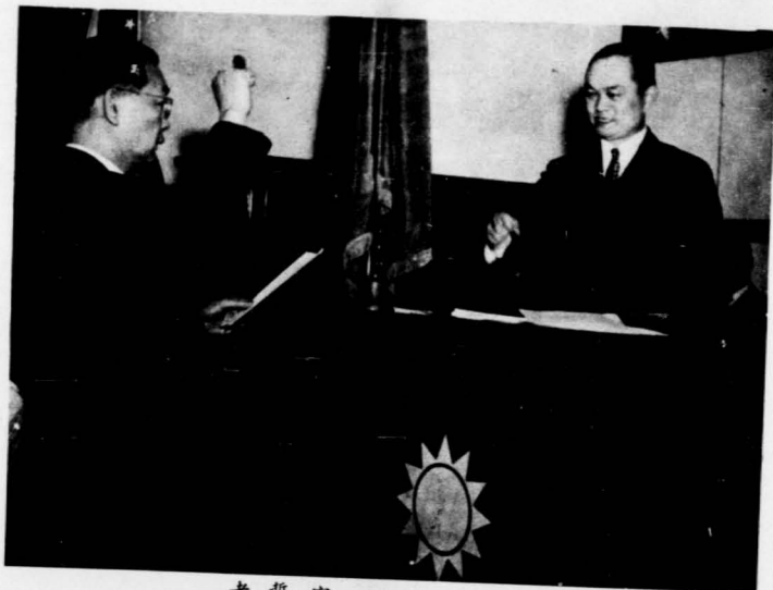
宣 普 者 監 普 者 生 天 伍 記 書 兼 事 幹 部 團 區 屬 直 東 美 團 年 青 軍 將 澤 康