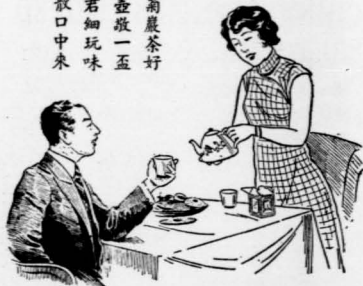
飲 茶 不 忘 雪 莉