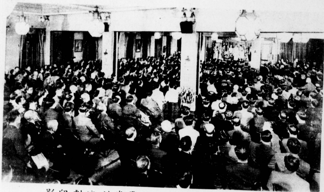
芝城安良工商會慶祝抗戰勝利演劇留影