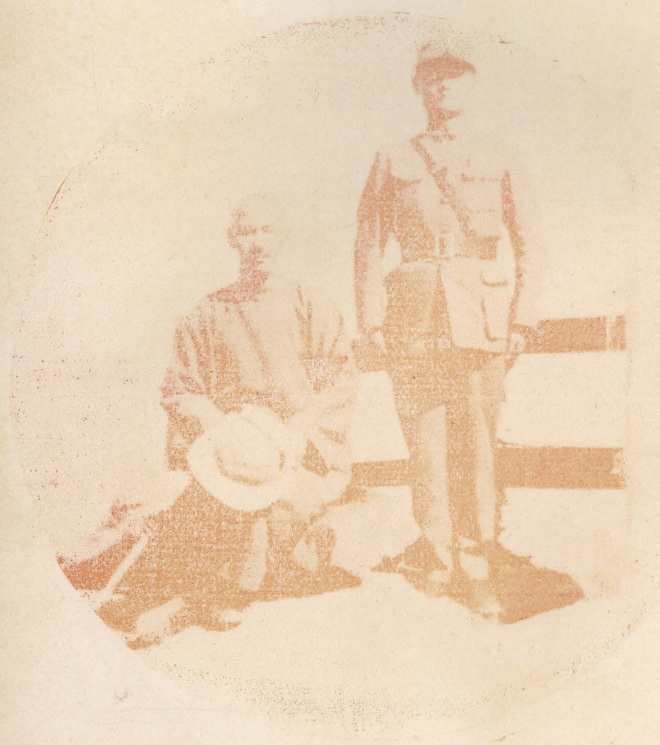
民國二十五年中秋節本班主任隨 校長在廬山五老峯上合影