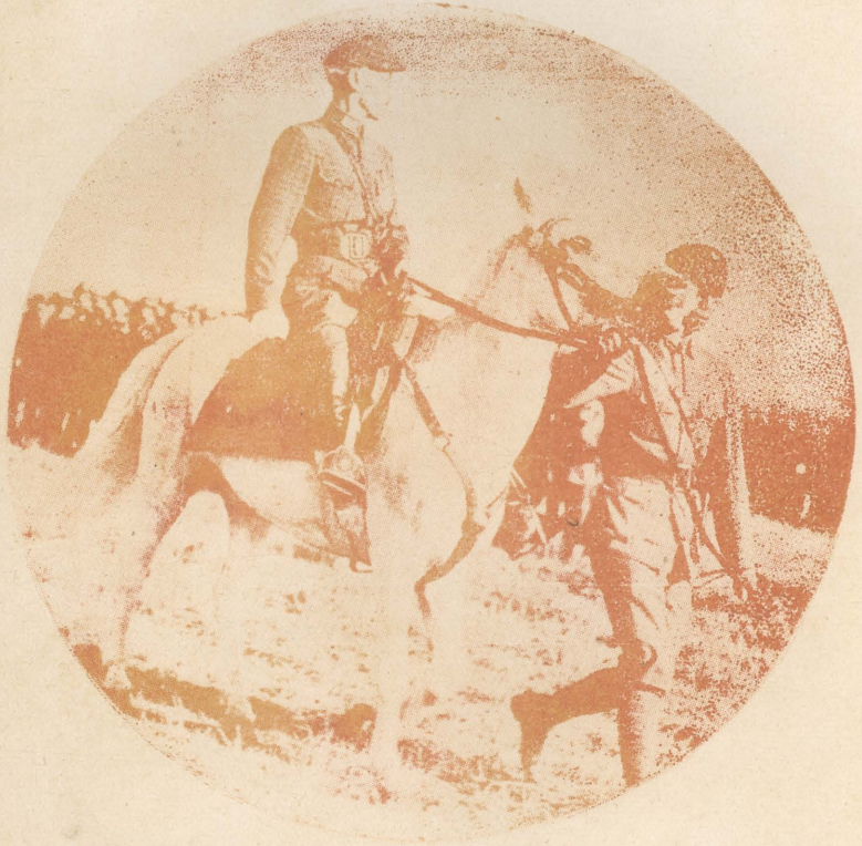
北伐軍十週年紀念 閱兵典禮