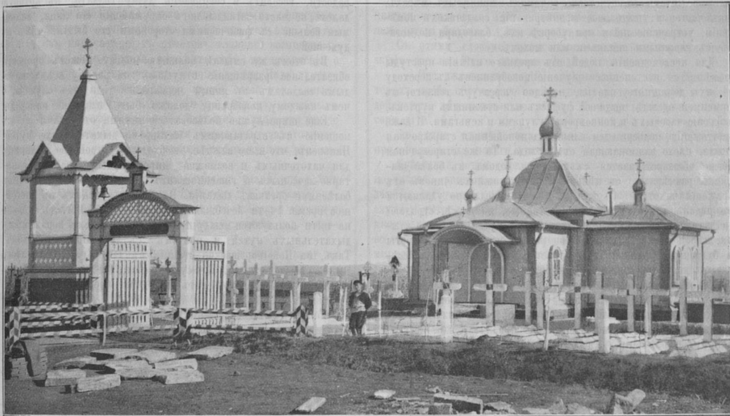
Военное кладбище въ г. Оренбургѣ.

Гдѣ же кроются причины столь широкаго распространенія въ арміи бугорчатки вообще и легочной въ частности? Не касаясь причинъ, общихъ для всего населенія, я сдѣлаю сводку только тѣхъ, специальныхъ для арміи, причинъ, какія приводятся въ отчетахъ военно-медицинскаго управленія за 10 лѣтъ. Это слѣдующія: 1) низкій, въ смыслѣ физическаго развитія, цензъ прибывающихъ на пополненіе частей новобранцевъ, нерѣдко слабогрудыхъ и истощенныхъ; 2) вліяніе рѣзкой перемены климата, сказывающееся особенно сильно при комплектованіи сѣверныхъ округовъ обитателями среднихъ и южныхъ полосъ Россіи; 3) недостатки казарменныхъ помѣщеній: холодъ и сырость въ нихъ, отсутствіе въ большинствѣ случаевъ манежей и отдѣльныхъ залъ для строевыхъ занятій и производство таковыхъ въ жилыхъ помѣщеніяхъ. Последнее имѣетъ двойную невыгоду: разгоряченные движеніемъ при комнатной температурѣ люди легко простуживаются, выходя на воздухъ, а поднимаемая при ученьяхъ пыль наполняетъ жилую атмосферу, что не остается безъ вліянія на дыхательные пути. Отдаленное положеніе отхожихъ мѣстъ, по большей части холодныхъ и не соединенныхъ съ казарменными корпусами крытыми ходами, равнымъ образомъ значительная отдаленность бань также являются частымъ источникомъ простуды. По-