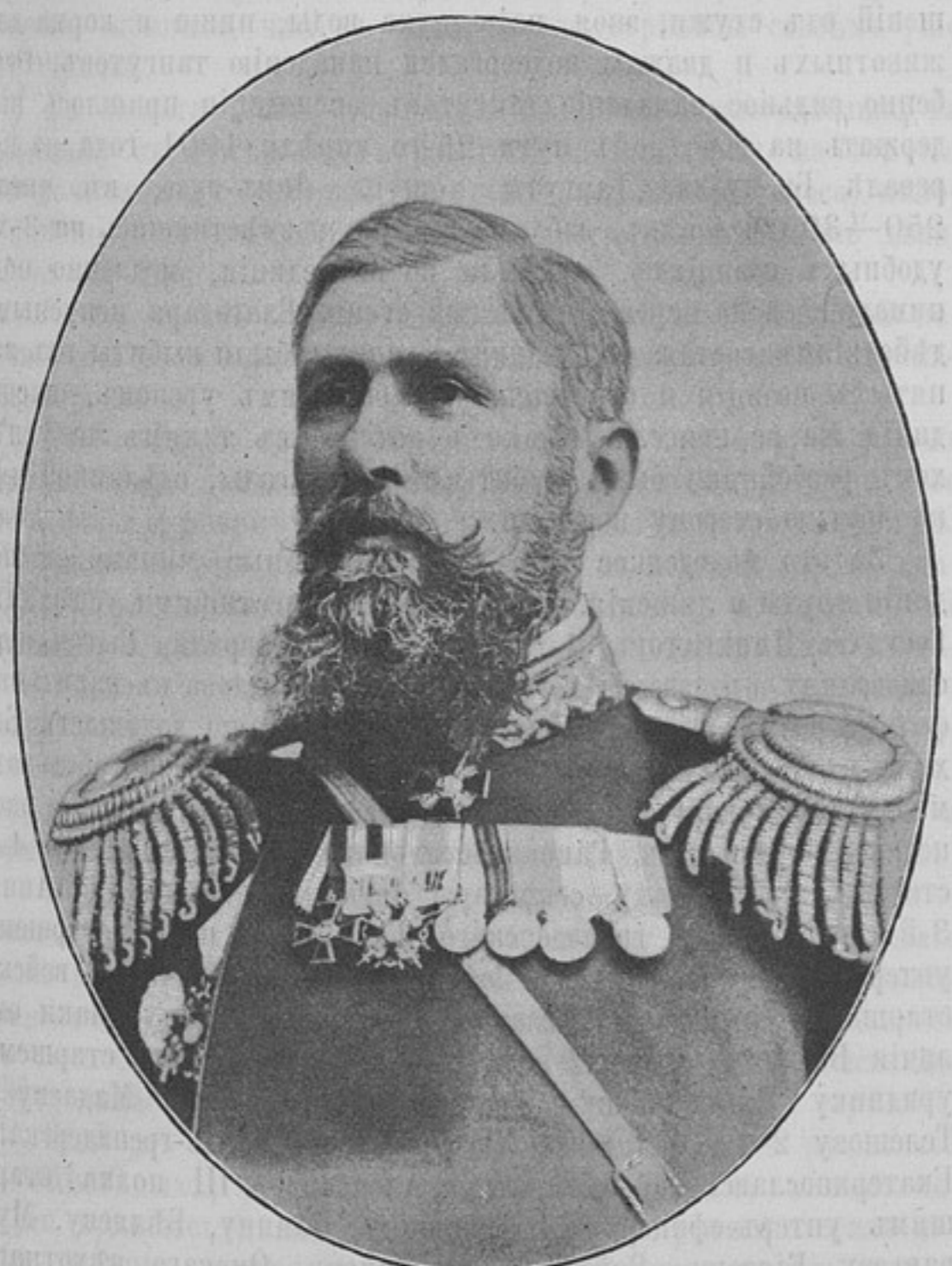
Военный губернаторъ Забайкальской области, командующій въ оной войсками наказный атаманъ Забайкальскаго казачьяго войска, генераль-лейтенантъ Иванъ Павловичъ НАДАРОВЪ. Родился въ 1851 г. Образованіе получилъ: въ Петровской-

Состав. Б. Л. Тагъевъ. 1902 г. . . . . 75 коп.