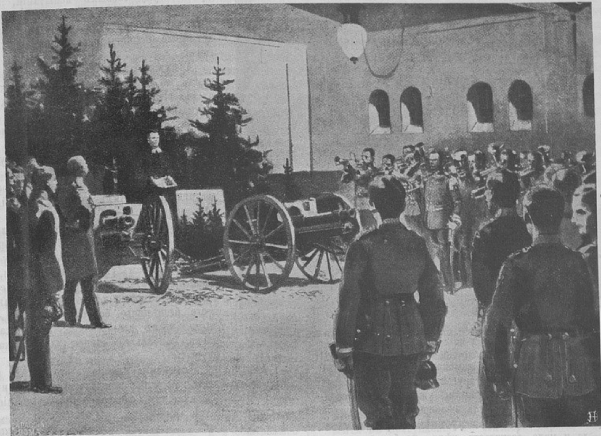
Празднованіе Рождества Христова въ германской казармѣ.

Это большой талант — и притомъ безконечно полезный для нашего дѣла!