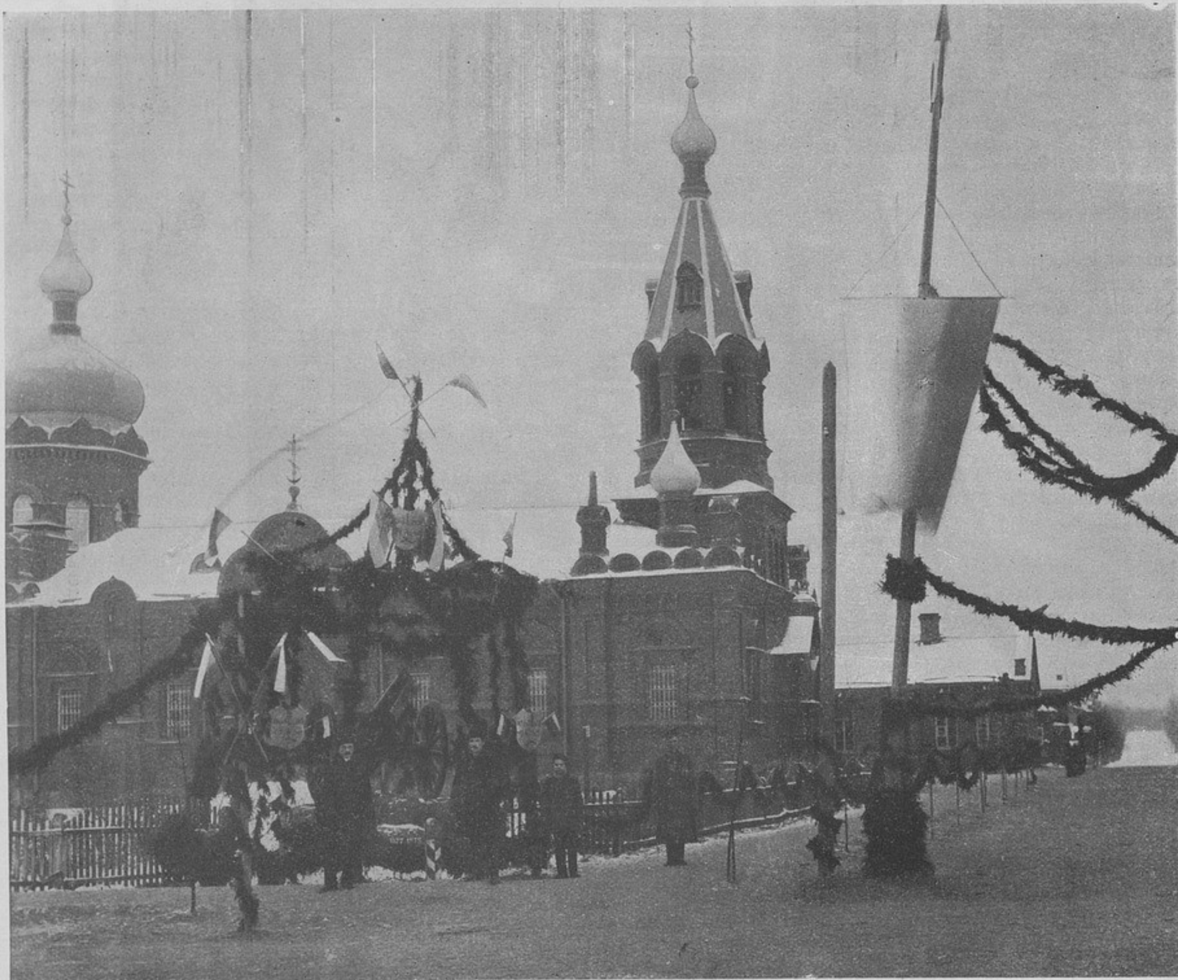
Церковь 24-й арт. бригады. Рядомъ съ нею турецкая пушка. (Къ корресп. „Лука“).

Нельзя же отрицать, что краснорѣчивое и искреннее