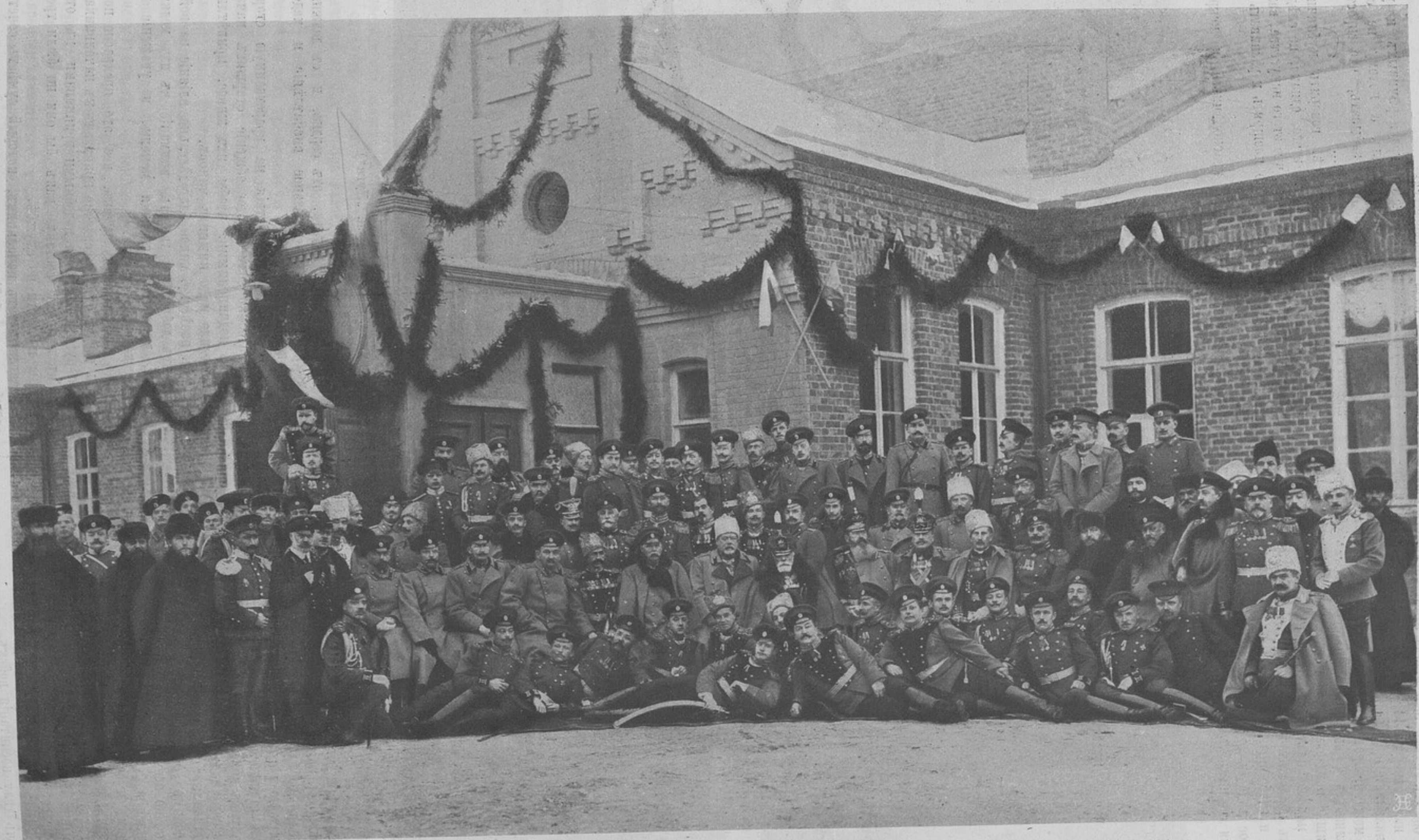
Офицеры 24-й артиллерійской бригады, въ день юбилея бригады. (Къ корресп. „Луга“).