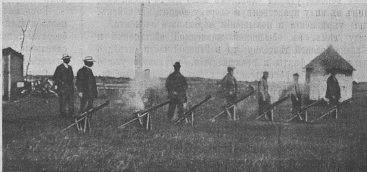
Опыты съ приборами для метанія ручныхъ гранатъ.

Не надѣясь на самихъ себя, мы стали питаться тѣми