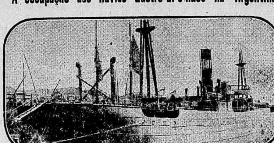
O vapor allemão "Muansa" atracado no dique 4, em Buenos Aires, já occupado pela marinha argentina