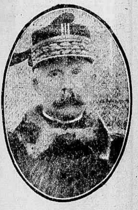
O general Pétain

A nova modificação no alto commando francez, com o restabelecimento do cargo de chefe do estado-maior junto ao Ministerio da Guerra, e da nomeação de Pétain para o exercicio, parece logo a primeira vista uma dimi-