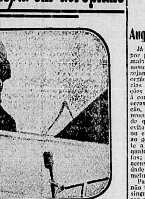
O chancelier Müller - O chancelier Bethmann

há vão apparecendo sinais de impaciencia por parte mesmo dos organos que até agora mais confiantes se mostravam na acção de nosso Ministerio do Exterior. Quaesquer que sejam os interesses ou a sympathia desses organos pelo actual chancelier, as circumstancias não de levam a formular interrogantes que venham por outros tantos accusos á condução do Itamaraty. Como é habito em occasião como esta fazer praça de insupezão, devemos accentuar que esta folha tem procurado conservar, a mais discreta attitude quanto á nossa situação internacional, evitando criticas e informações precipitadas ou erroneas, que possam crear difficuldades ao governo. Ninguém mais do que nós soube a responsabilidade que a imprensa do qualquer país com os nossos deliciaes "monstruosos", mas, felizmente, a chancellaria não nos accessa até aqui do praticar nenhuma levandada que pudesse concorrer para tornar mais melindrosa a situação brasileira.