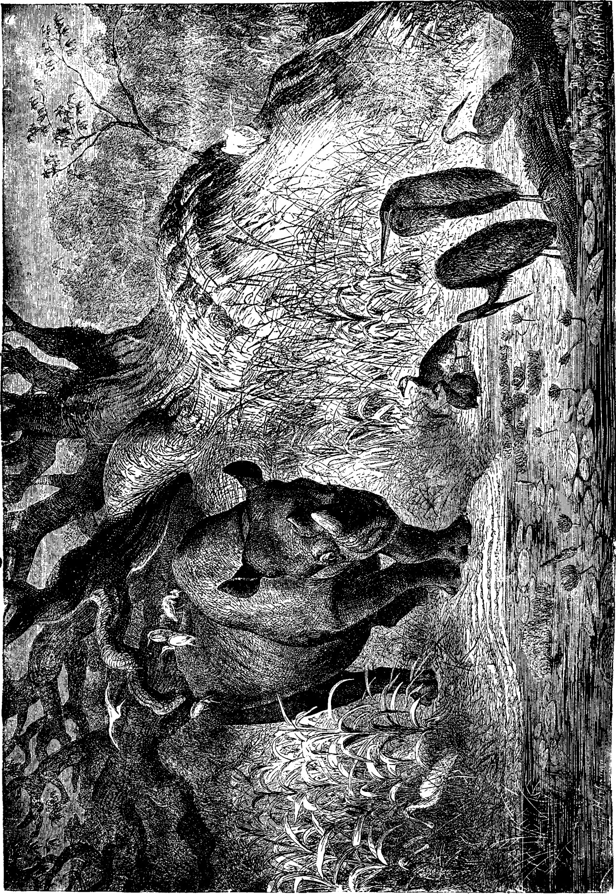
R I N O C E R U L .