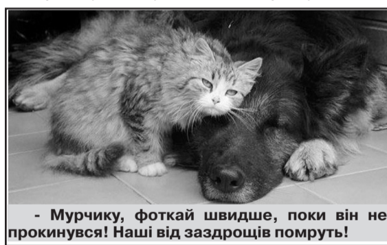
- Мурчику, фоткай швидше, поки він не прокинувся! Наші від заздощів помруть!

Тут під'їжджає №63. Блондинки зраділи і одна каже до другої: - Класно, поїдемо разом!