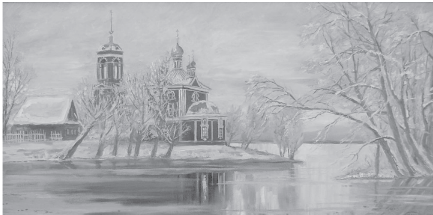
Сорокосвятская церковь - любимая тема художника