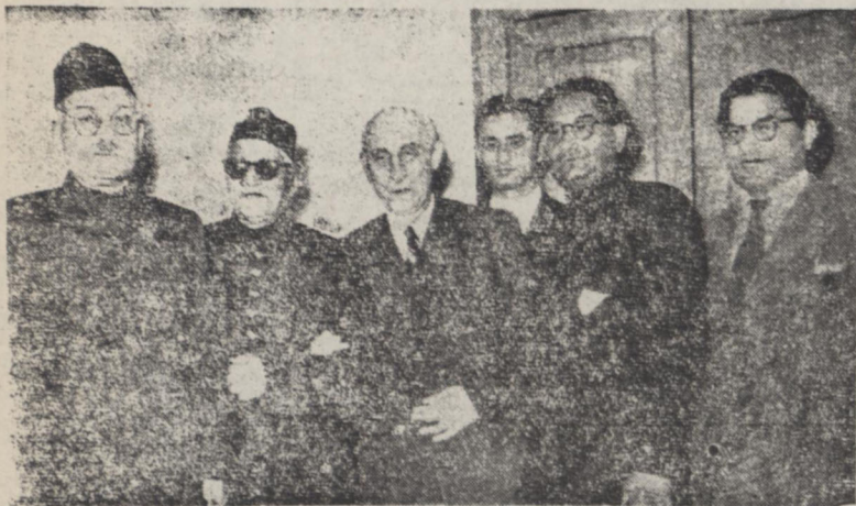
از چپ بر راست آقایان دکتر: نارچند سفیر کبیر هند در ایران - چندا معاون وزارت خارجه مصر - دکتر مصدق نخست وزیر - دکتر سید محمود نایبند مجلس هند و رئیس میسیون مودت هند و آقای سید نظیر حسین در ملاقات با نخست وزیر - آقای نیری میهناندار میسیون نیز در این عکس دیده میشود.

شدند و سپس نخست وزیر را ملاقات کردند و امروز پس از ملاقات با آیت الله کاشانی از مجلس شورای ملی دیدن نمودند معاون وزارت خارجه ضیافتی با افتخار میسیون مودت هند خواهد داد اعضای میسیون مودت مسافرتی بشمال یا اصفهان خواهند کرد