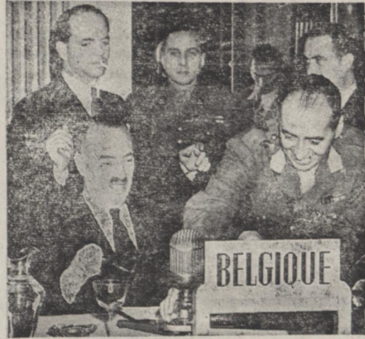
دوای بلژیک وزیر خارجه باؤیک هنگامیکه خود را برای ایراد نطق در جلسه شورای وزیران اروپا حاضر میکند

روزهم شورای وزیران خارجه اتحادیه اروپا تشکیل جلسه دادند و درباره مهاجرین بلغارستان و یونان مسئله روابط آلمان غربی با آلمان شرقی و وحدت آلمان و بعضی مسائل دیگر مذاکره کردند. ولی ناظرین مطلع عقیده دارند که این دوره اجلاس به شورا نتایج مهمی نخواهد داشت و علاوه بر تصمیمات علمی و رسمی که اتخاذ میشود اقدامات مهمتری صورت خواهد گرفت که هدف آن تقویت آلمان غربی در برابر آلمان شرقی و کمک بیوان در مسئله مهاجرین و نیز اقدامات دیگری برای مبارزه با بحران اقتصادی اروپای غربی خواهد بود. امروز هم وزیران خارجه پانزده کشور عضو شورای اروپا متفق اعلام نمودند که اگر هم جنگ سرد کنونی بین دو بلوک شرقی و غربی جهان از بین برود کشورهای مزبور برای وحدت اروپا همچنان یکپوشش خود ادامه خواهند داد. وزیران مزبور سپس خاطر نشان کردند که از تصمیم قلب خواهان صلح هستند و برای وقت اختلافات بین المللی از طریق سلامت آمیز اقدام لازم بعمل خواهند آورد.