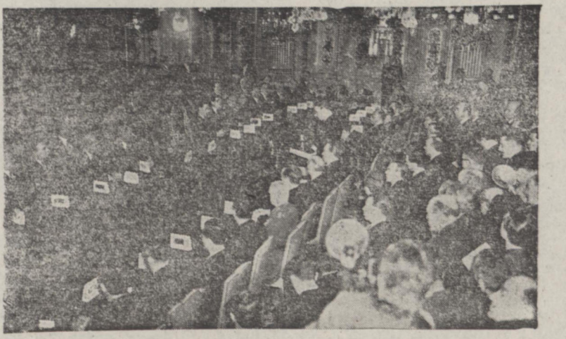
جلسه عمومی شورای وزیران اروپا که با حضور کلیه وزیران خارجه و دفاع کشورهای اروپای غربی در شهر استراسبورگ تشکیل شده در این عکس میباید دید وزیر خارجه فرانسه هنگام ایراد نطق دیده می شود.

برای تهیه بلیط به نمایندگی های مجاز ک. ال. ام. در شرکت هوا پیمانی ایران مراجعه فرمایید ۲۰۷۸-آ