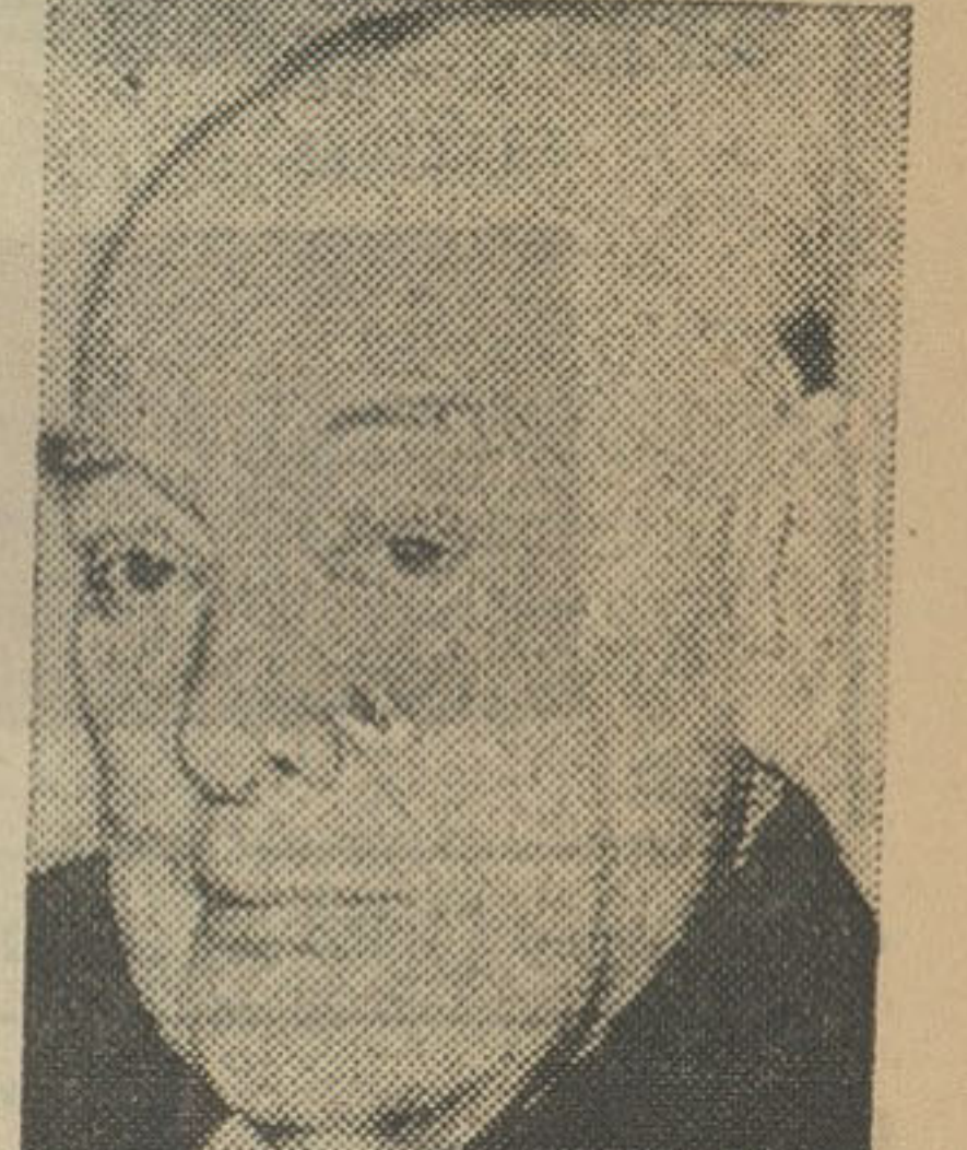
یونیورسک ۱۴ مارس - آسوشیتد پرس - عبدالمنعم رفائی رئیس هیئت اجرایی آمریکائی شد

نماینده گی اردن در سازمان ملل دیروز اظهار داشت که وی معتقد است در نتیجه جریانات سیاسی اخیر خاور میانه و کودتای سوریه و عراق هیچگونه تهدید فوری علیه اردن و آرامش این منطقه بوجود نیامده است. وی که از راه اردن وارد پاریس میگردد گفت جریانات اخیر خاور میانه نمودار اهمیت یافتن نقش جهان عرب در اوضاع سوریه و عراق صلح است. وی اضافه کرد هیچگونه تهدیدی متوجه امنیت اردن نیست و او معتقد است که ایجاد همکاری بین کشورهای عربی میتواند با استحکام وضع جهان کمک کند رفاهی که برای مذاکره حضوری با مان احضار شده است بخیرنگاران اظهار داشت من در امان با اعلیحضرت ملک حسین و مقامات دولتی تبادل نظر خواهم کرد و همچنین تمام جریانات مربوط