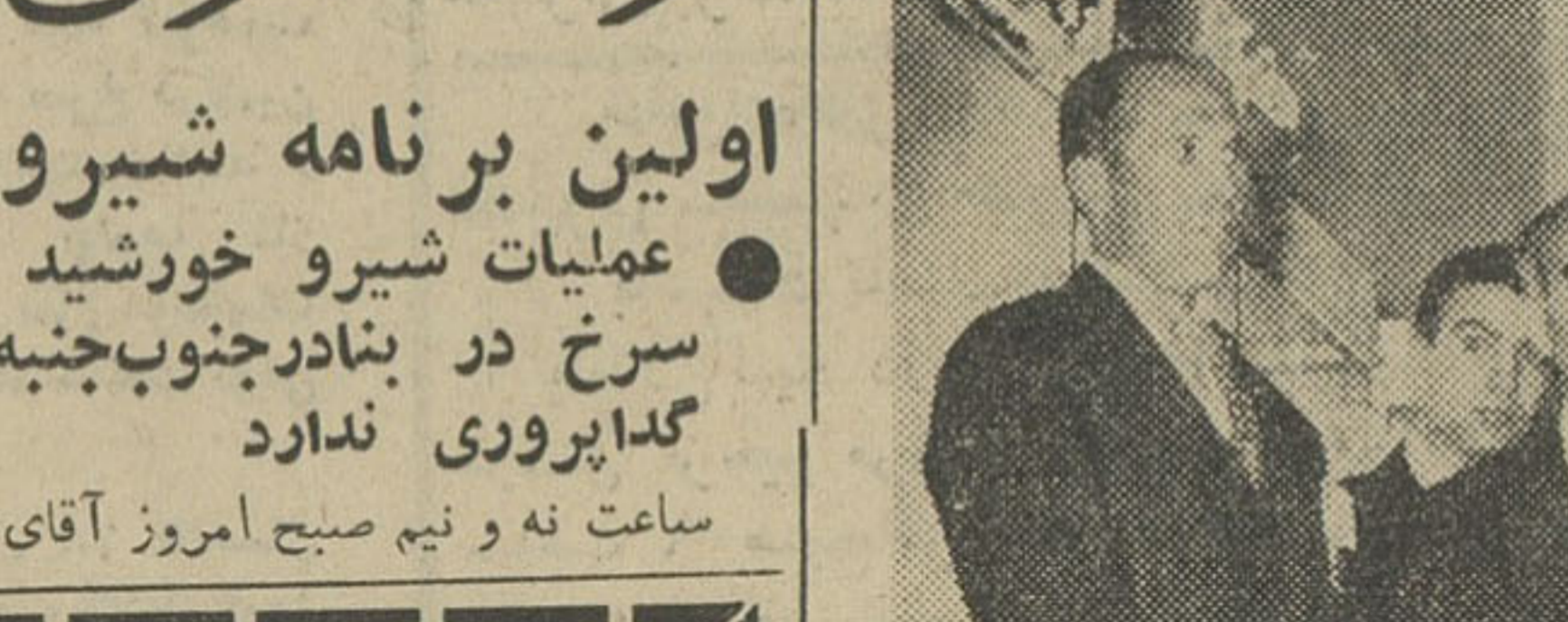
دکتر خانلری وزیر فرهنگ در مورد پرداخت فوق العاده کارصادر شد : برای آنکه پرداخت فوق العاده اضافه کار بر مبنای صحیحی در مقابل کار اضافی پرداخت گردد مقررات ذیل وضع و برای اجرا بقیه در صفحه ۱۴