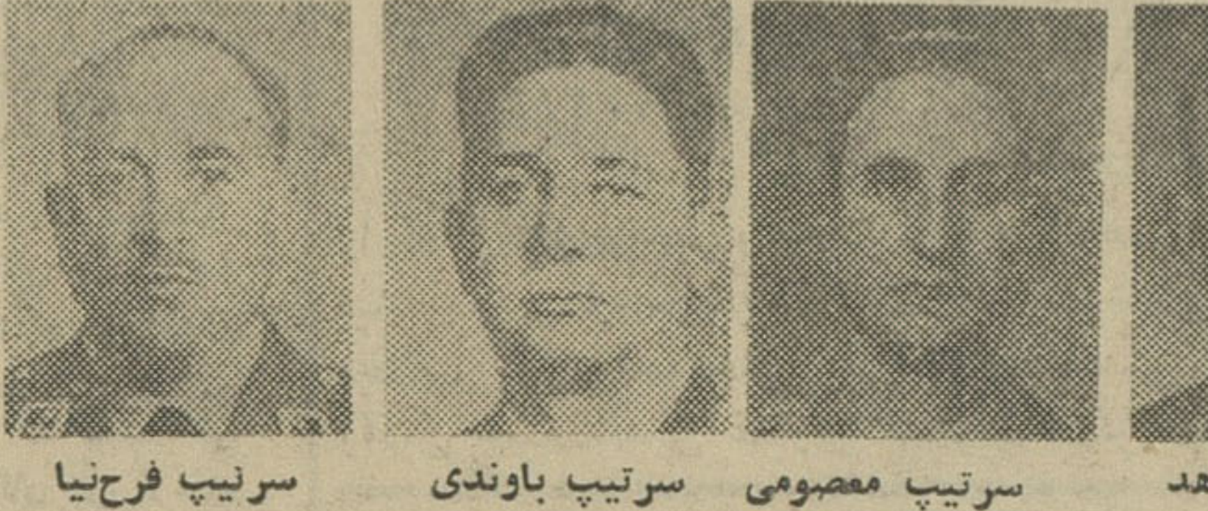
سرلشکر مینباشیان ، سرتیپ جاهد ، سرتیپ مصومی ، سرتیپ باوندی ، سرتیپ فرحنا

اعلامیه وزارت دربار شاهنشاهی اعلامیه زیر ساعت شش بعد از ظهر دیروز از طرف وزارت دربار شاهنشاهی انتشار یافت : وزیر دربار شاهنشاهی با نهایت مسرت با اطلاع عموم میرساند که خداوند متعال در ساعت پنج و سی دقیقه بعد از ظهر امروز (سه شنبه بیست و یکم اسفند ماه ۱۳۴۱) به اعلیحضرت همایون شاهنشاه و علیا حضرت فرح بهلولی شهبانوی ایران دختری عنایت فرموده است . وزیر دربار شاهنشاهی - حسین علاه اعلامیه پزشکی درباره تولد نوزاد سلطنتی در ساعت پنج و نیم بعد از ظهر امروز (سه شنبه بیست و یکم اسفند ماه ۱۳۴۱) خداوند متعال نوزاد دختری به وزن چهار کیلو و هشتصد گرم به اعلیحضرتین اعطا فرمودند . حالت مزاجی علیا حضرت شهبانوی ایران و نوزاد کاملاً رضایتبخش و طبیعی است . سیمپهد دکتر کریم ایادی