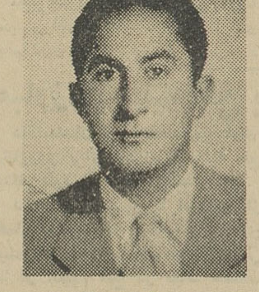
خبرنگار مادر کن گزارش میدهد