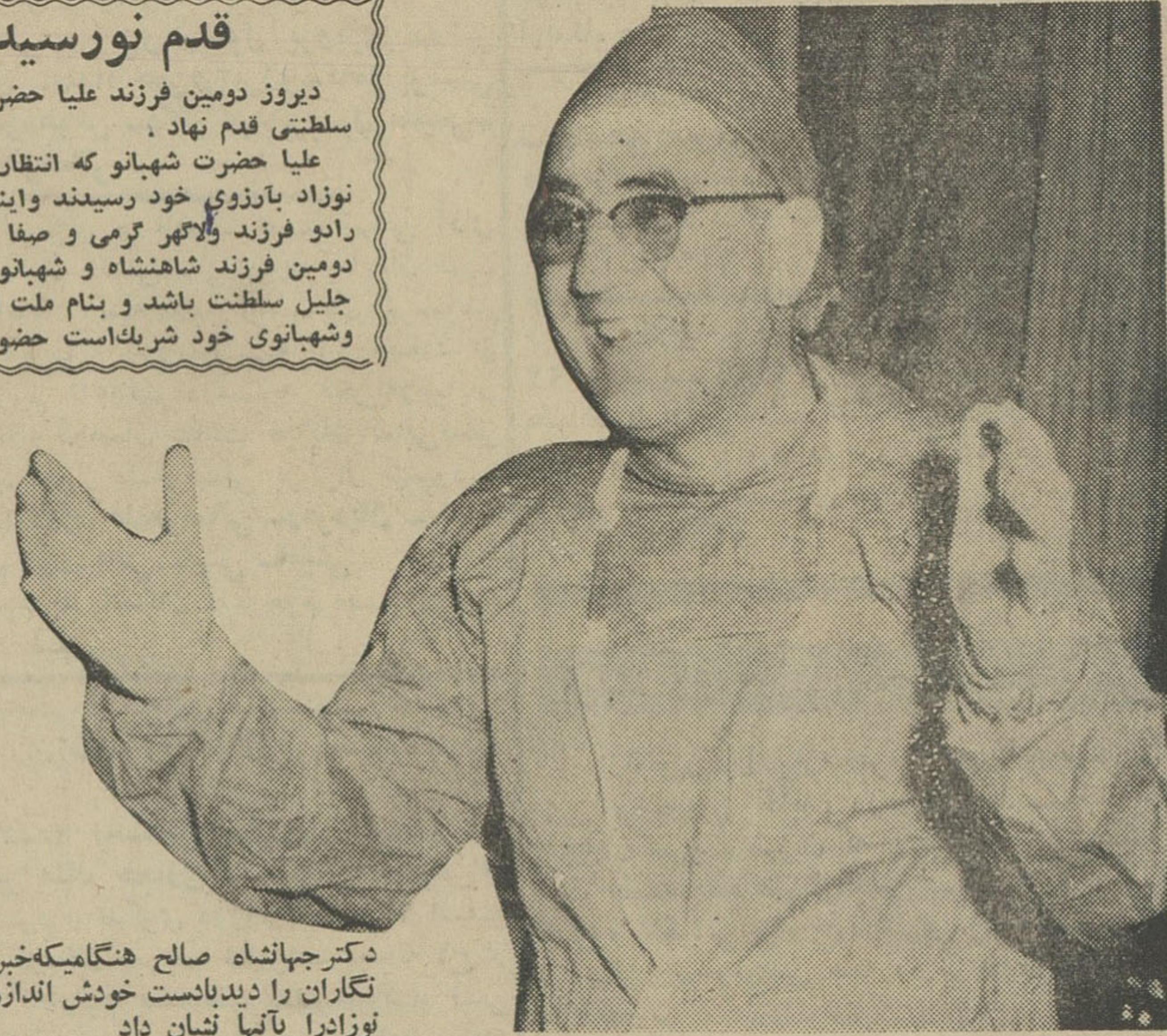
دکتر جهانشاه صالح هنگامیکه خبر نگاران را دید با دست خودش اندازه نوزاد را با تپا نشان داد

قدم نورسیده مبارک باد دیروز دومین فرزند علیا حضرت شهبانوی ایران باغوش خانواده سلطنتی قدم نهاد . علیا حضرت شهبانو که انتظار دختری را می کشیدند . باولاد نوزاد بارزوی خود رسیدند و اینک کانون خانوادگی شاهنشاه ایران را دو فرزند و لایق گرمی و صفا می بخشند ، ما آرزو داریم قدم دومین فرزند شاهنشاه و شهبانو منشاء خیر و خرمی برای خانواده جلیل سلطنت باشد و بنام ملت ایران که در این سرور با شاهنشاه و شهبانوی خود شریک است حضور اعلیحضرتین تبریک عرض میکنیم .