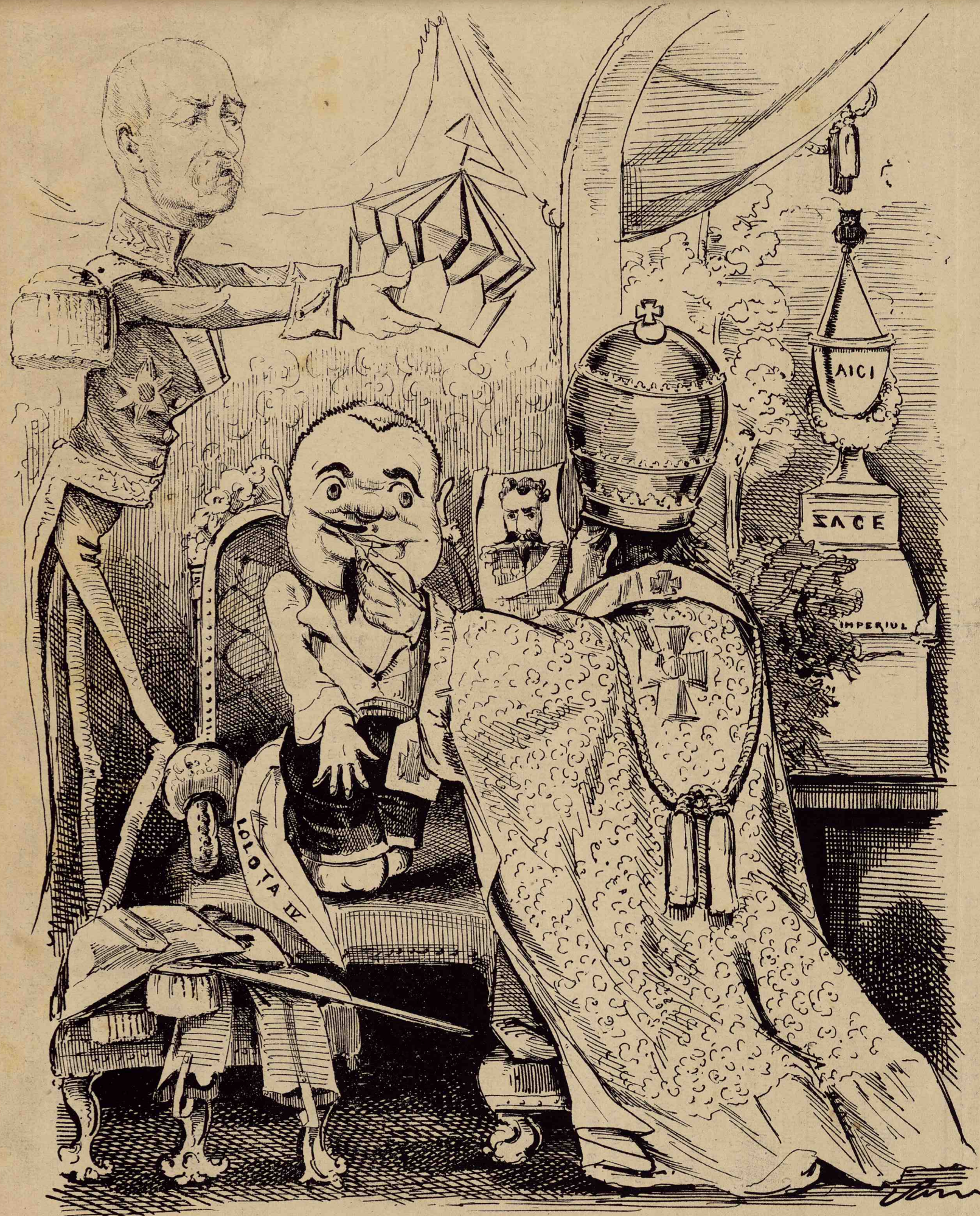
Caraghioslucurile din Franța!