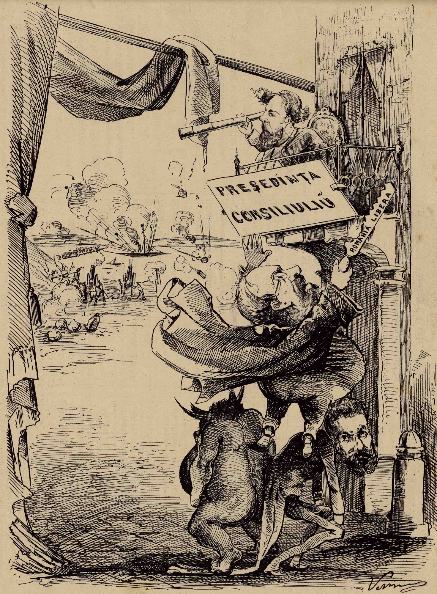
Caraghioslucurile din România!