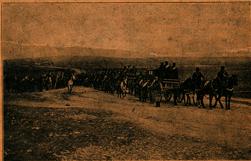
Телеграфско одељење дунавске дивизије на бојном пољу.