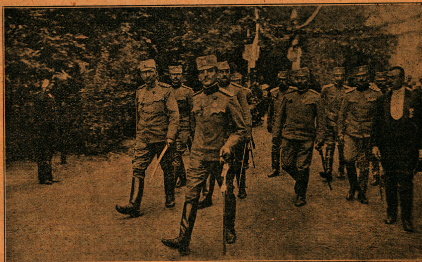
Славље у Београду: Престолонаследник Александар са својим штабом полази на свечаност открића споменика.

Тако је Бугарска доживела велико разочарење, да је се врло брзо одрекну сви они чију је националну свест држала на ножу и пушци.