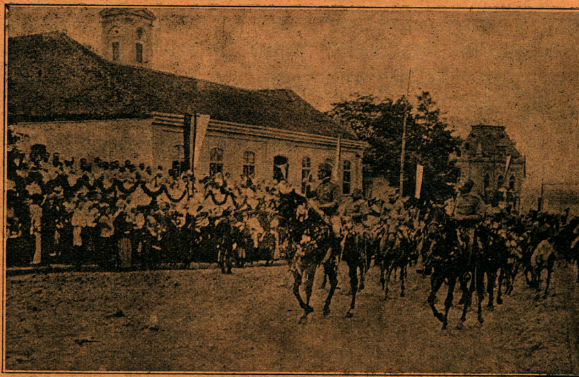
Славље у Београду: Народ поздравља престолонаследника Александра и храбру му војску.

Егеја вали, таласи Јадрана, О побједниче, на те већ чекају. Да славној српској војеводи Заоре пучином епиникиј.