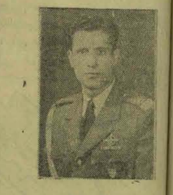
سرکرد خاتم خلیان مخصوص شاه

نمایر قراغان خلع صلاح شدند ستاد ارتش اطلاع میدهد که خلع بلاغ در قراغان پایان یافته و در مورد ۲۸۰ تنه اسلحه کوری تفک بعد از جمع آوری شده است