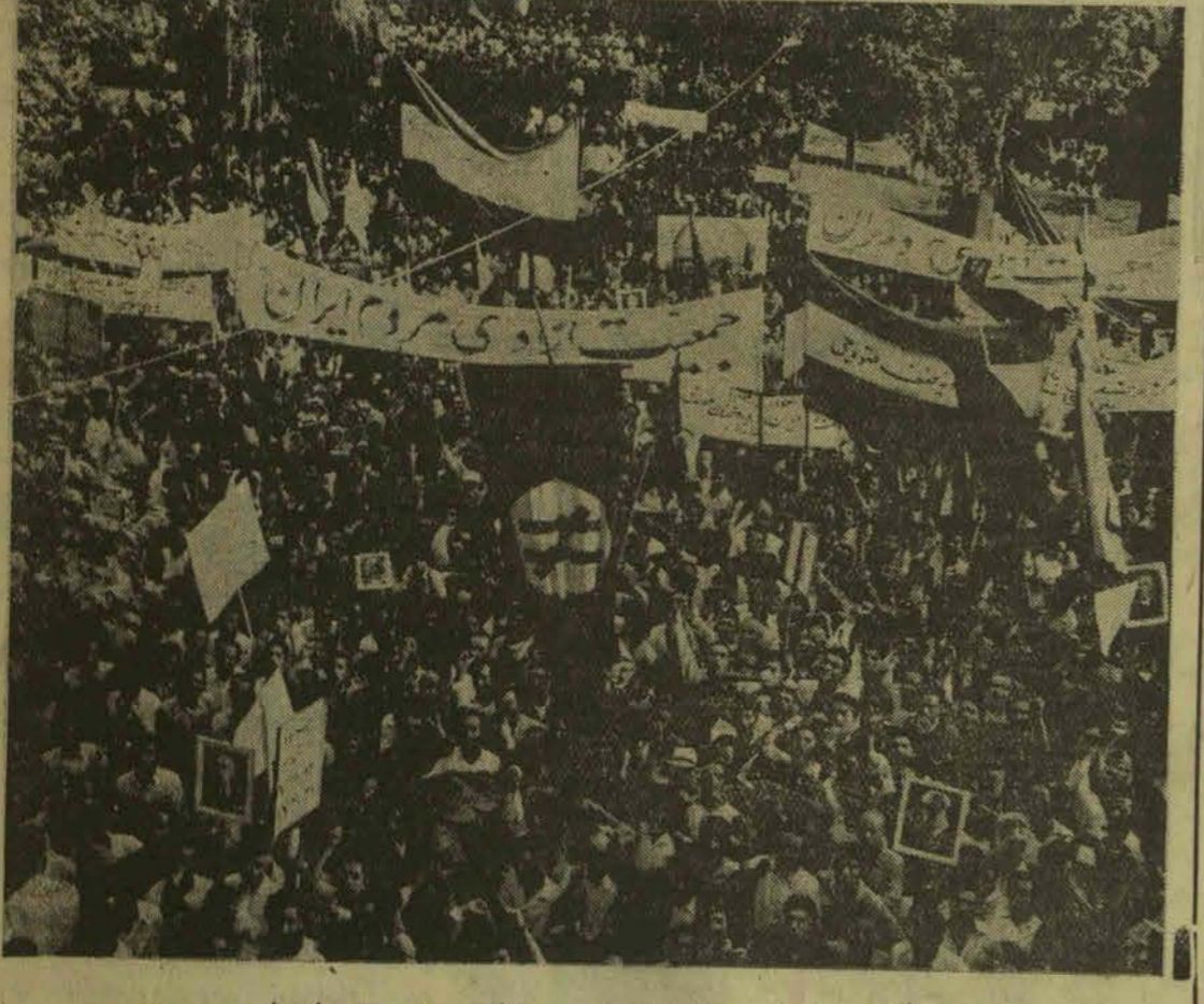
گروهی از اجتماع افراد احزاب در متینک دیروز میدان بهارستان

در همه جا فریاد «مصدق پیروز است» بگوش میرسید - بدربار شاه حمله شد و دربار مسبب کودتا معرفی گردید طی قطعه نامه متینک تقاضا شد : شورای سلطنتی تشکیل گردد