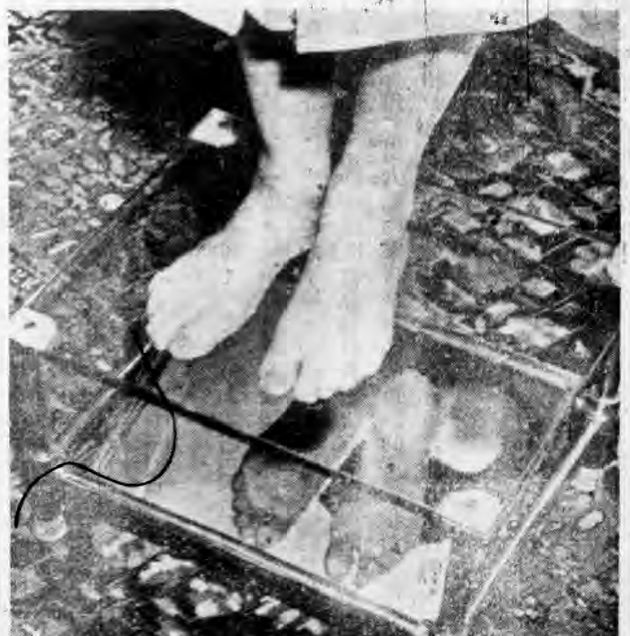
踏在玻璃鏡上，以知其立時之雙足姿勢。