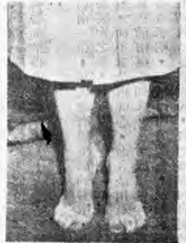
後跟高起，訓練重心。