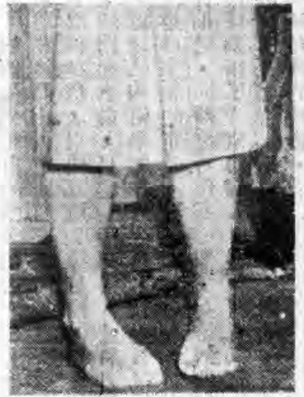
足趾伸縮，增長踝力。