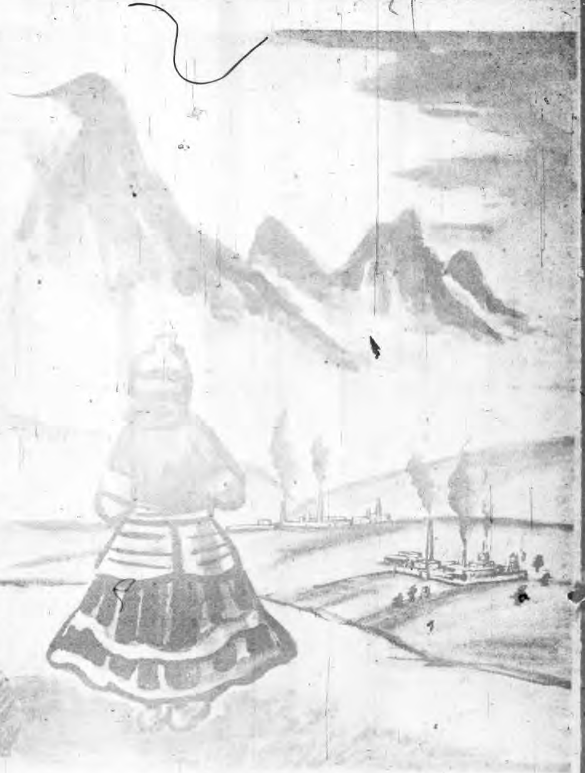
中國內地之煙台