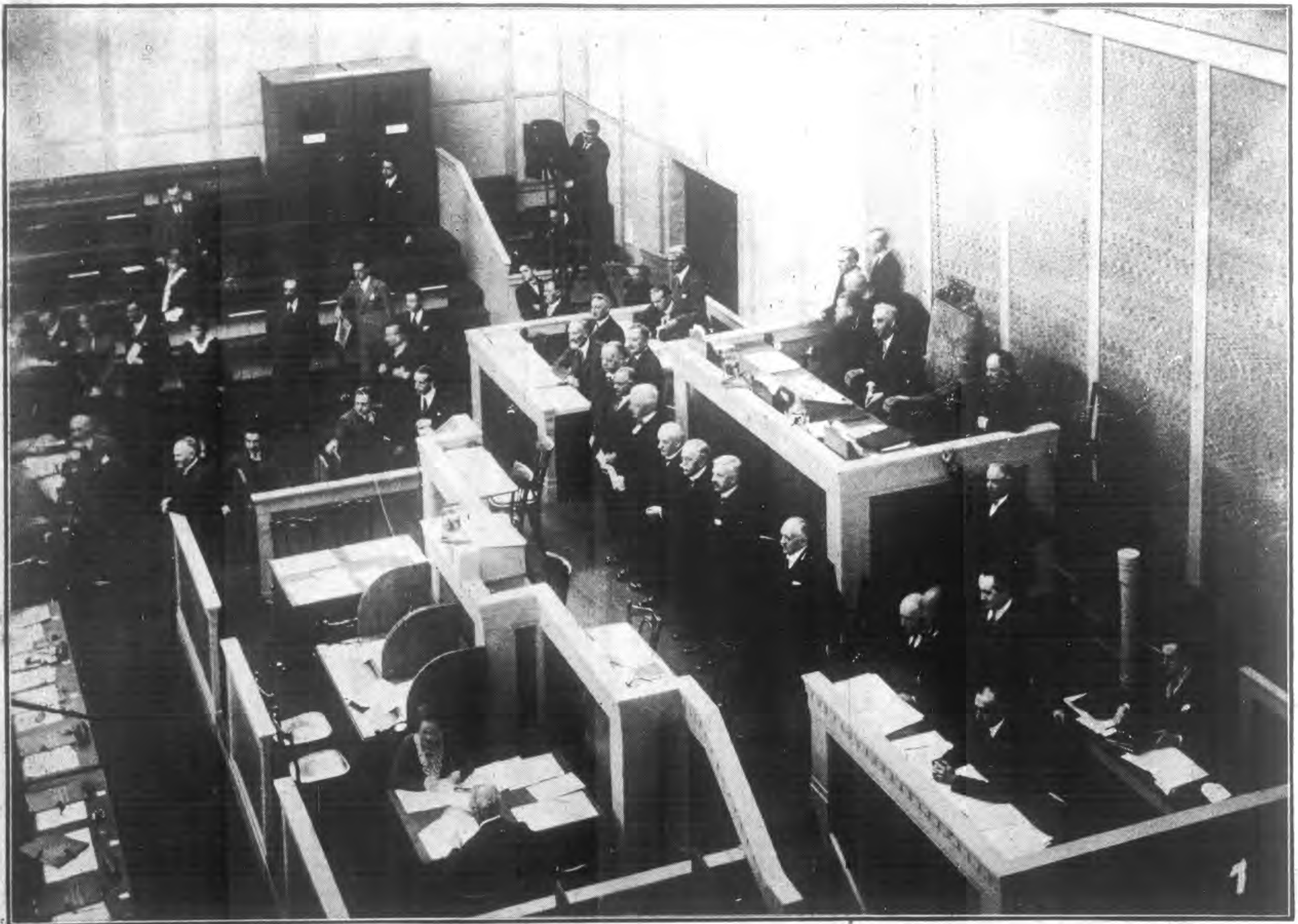
第 十 六 屆 國 際 勞 工 大 會 (一)