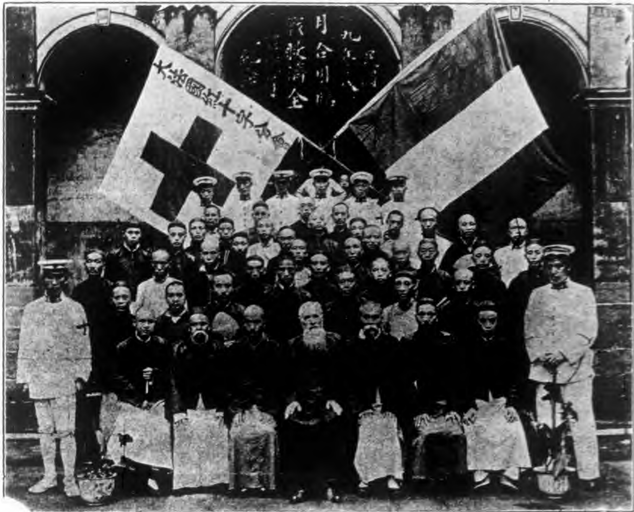
四川合川紅十字會戰時救濟委員會職員