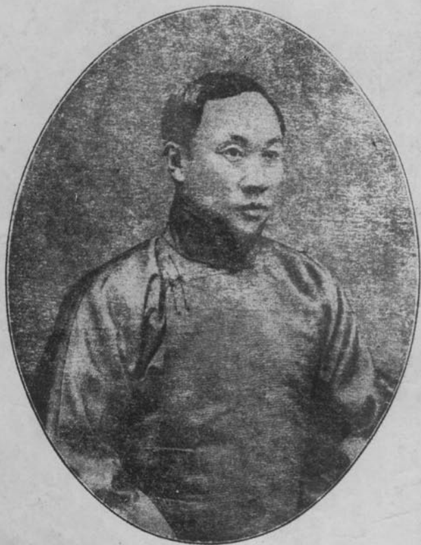
樵 月 呂